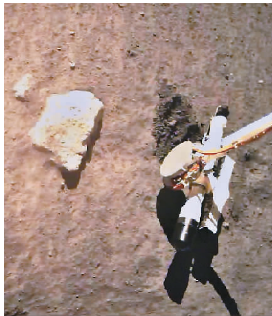
图为12月2日,嫦娥五号探测器在月球表面自动采样。