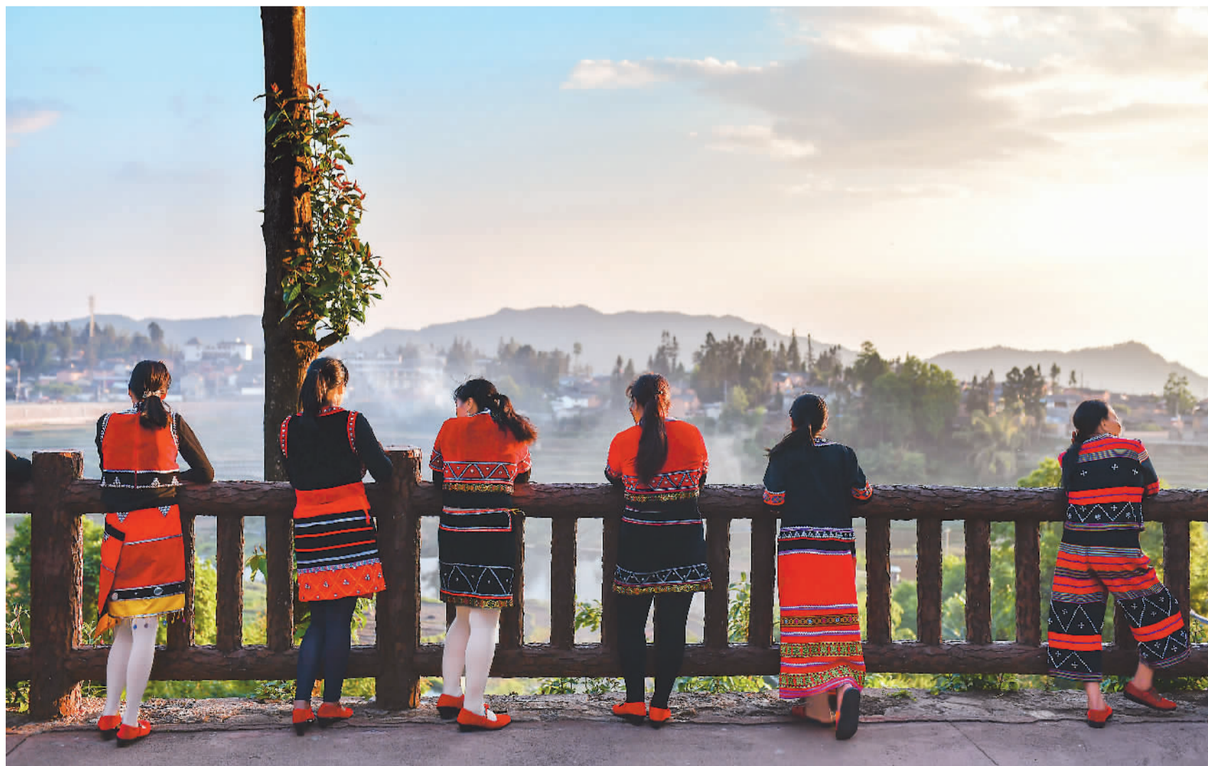
▲ 在云南省腾冲市清水乡三家村中寨司莫拉佤族村，村民在广场上休息。11月14日，云南省镇雄县、会泽县等9个贫困县(市)退出贫困县序列。这个贫困县数量曾居全国第一的省份，历史性地告别了延续千年的绝对贫困。