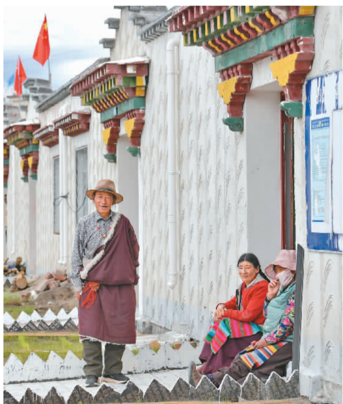
▲ 西藏自治区拉萨市当雄县羊八井镇彩渠塘村易地搬迁村民在家门口休闲。