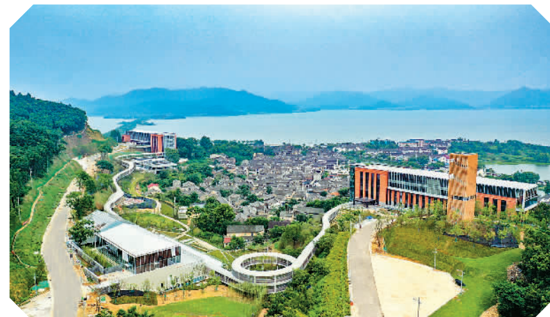
东钱湖畔的宁波院士中心