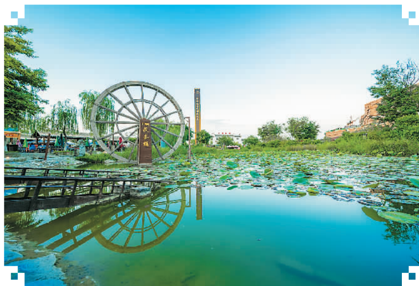
泾河新城茯茶镇风光