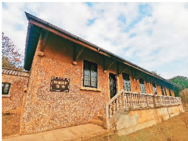
上图：姑塘海关宿舍。

在此期间，“万里茶道”还列入《“十三五”大遗址保护规划》、《丝绸之路经济带和21世纪海上丝绸之路文化遗产保护与交流合作专项规划(2018—2035)》。