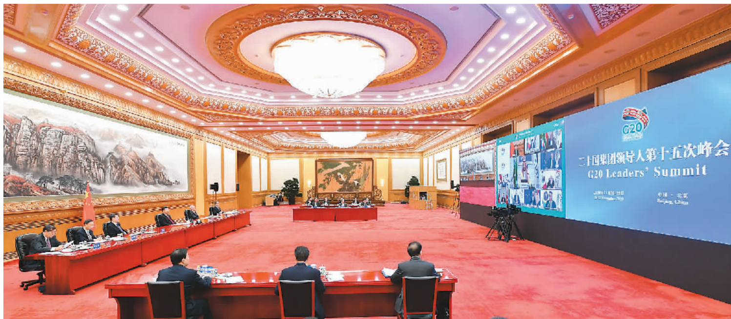
11月22日晚,国家主席习近平在北京以视频方式出席二十国集团领导人第十五次峰会第二阶段会议,重点阐述关于可持续发展问题的看法。

11月22日,国家主席习近平在二十国集团领导人利雅得峰会“守护地球”主题边会上致辞。新华社记者 李学仁摄