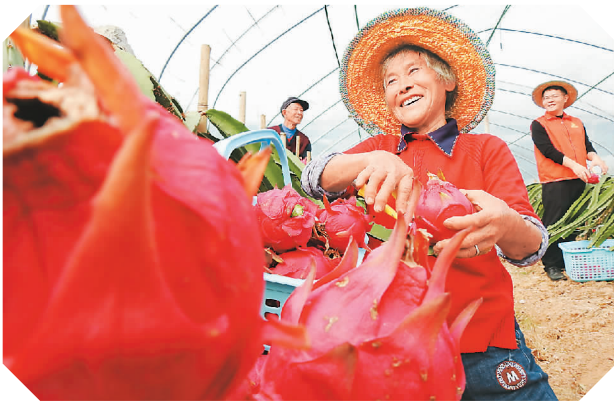
在四川省达州市高新区斌郎乡红花村火龙果种植基地，果农们近日正抢抓农时加紧采摘、分拣、装运外销“台湾火龙果”。该村四组返乡农民工创办的农民专业合作社，于两年前引进台湾红心火龙果、黄心火龙果大面积试种“南果北种”。经过精心培育，台湾火龙果成功“扎根”红花村。