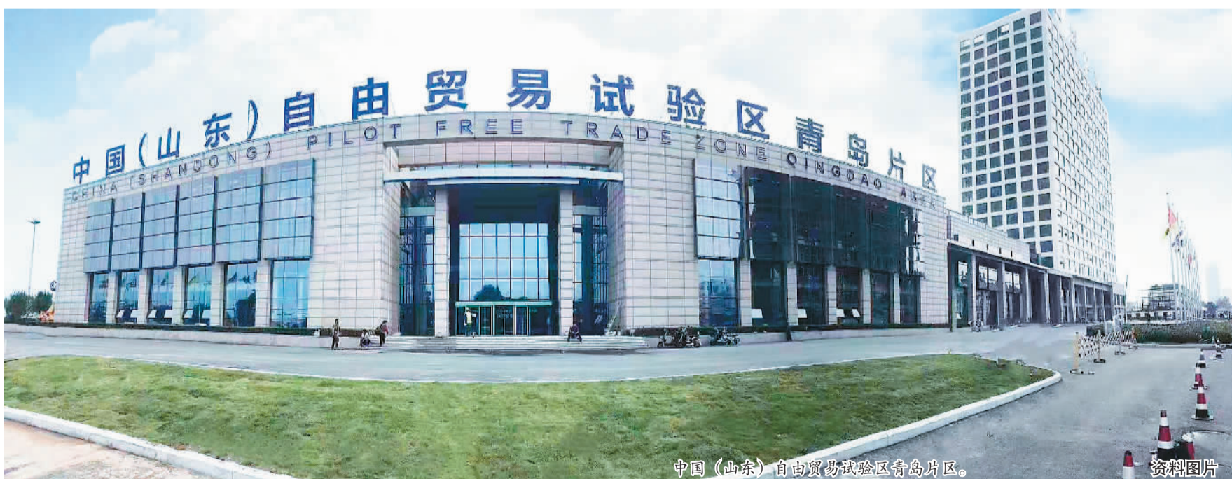
中国(山东)自由贸易试验区青岛片区。 资料图片