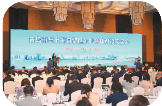
青岛在上海自贸试验区举办对接交流会。

当前，“双循环”新发展格局赋予了开放新的内涵。从国内大循环看，青岛既是东部沿海发达城市，