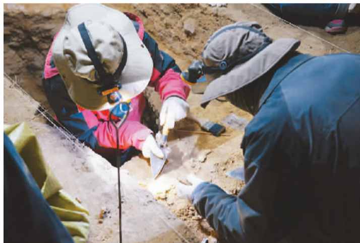
左图：甘肃夏河白石崖溶洞遗址出土的夏河人下颌骨。 右图：甘肃夏河白石崖溶洞遗址发掘现场。