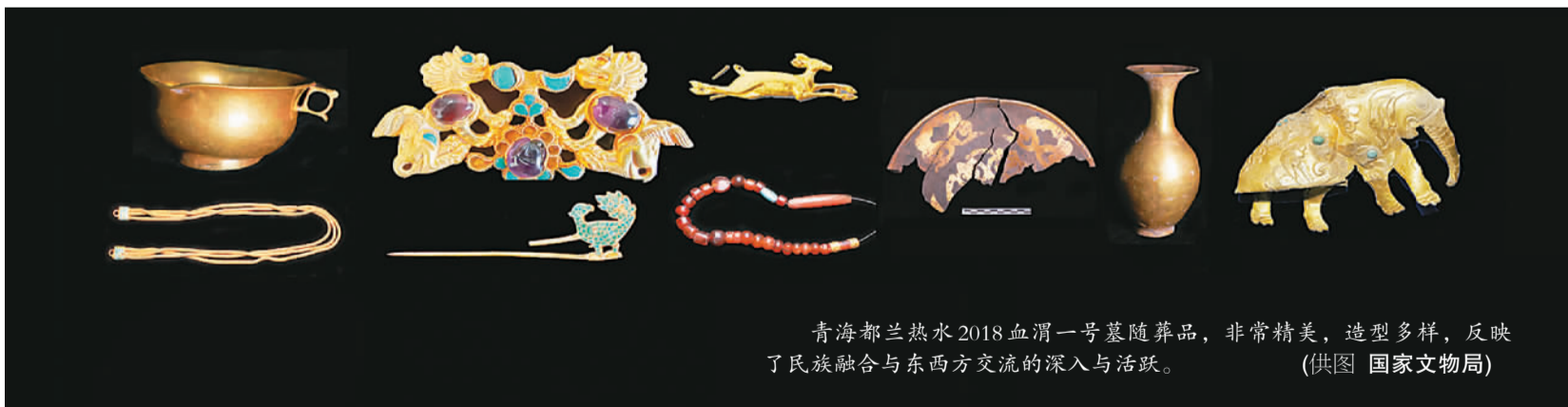
青海都兰热水2018血渭一号墓随葬品，非常精美，造型多样，反映了民族融合与东西方交流的深入与活跃。

青海都兰热水墓群位于青海省海西蒙古族藏族自治州都兰县热水乡境内，1982年考古发现并得名。2018年3·15热水墓群被盗案件侦破缴获大量文物，备受关注。