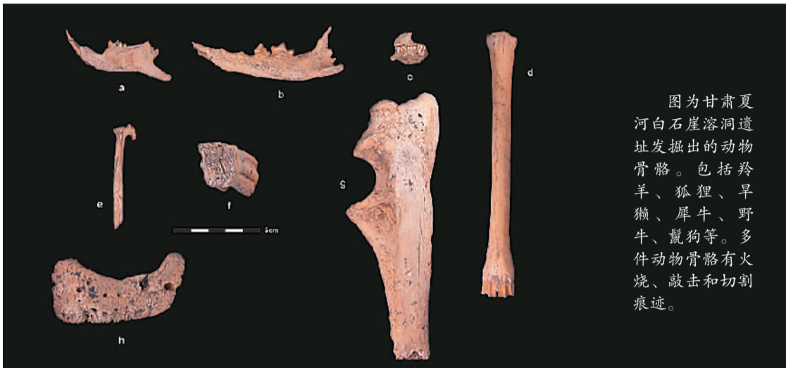
图为甘肃夏河白石崖溶洞遗址发掘出的动物骨骼。包括羚羊、狐狸、旱獭、野牛、野牛、鬣狗等。多件动物骨骼有火烧、敲击和切割痕迹。

白石崖溶洞遗址早年出土一枚古人下颌骨化石，经体质人类学、古蛋白和轴系测年技术分析，确认为距今约16万年前的丹尼索瓦人化石。