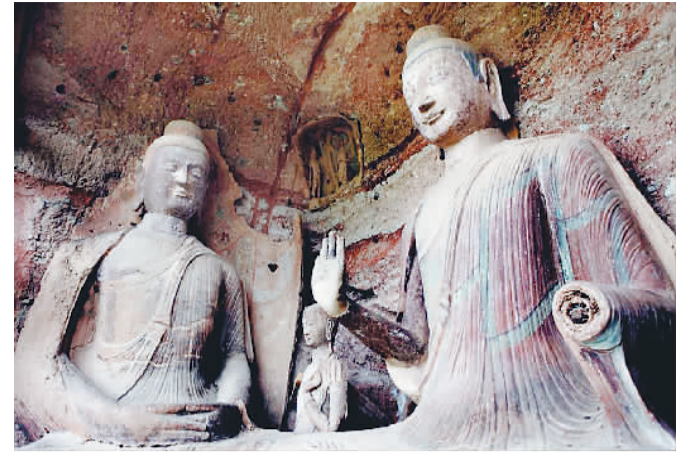
图为麦积山第78窟。