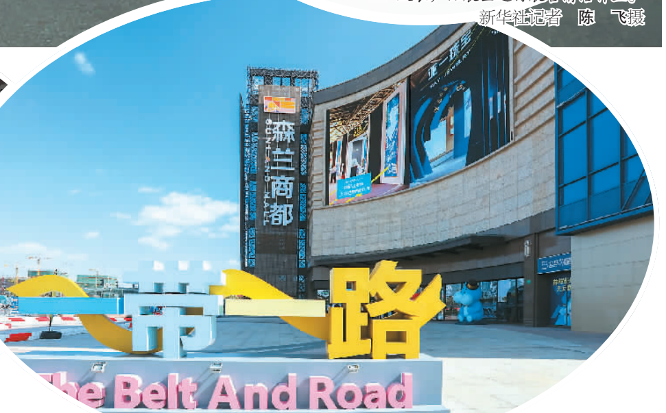
▲11月3日，迎接八方来客的“一带一路”国别汇。