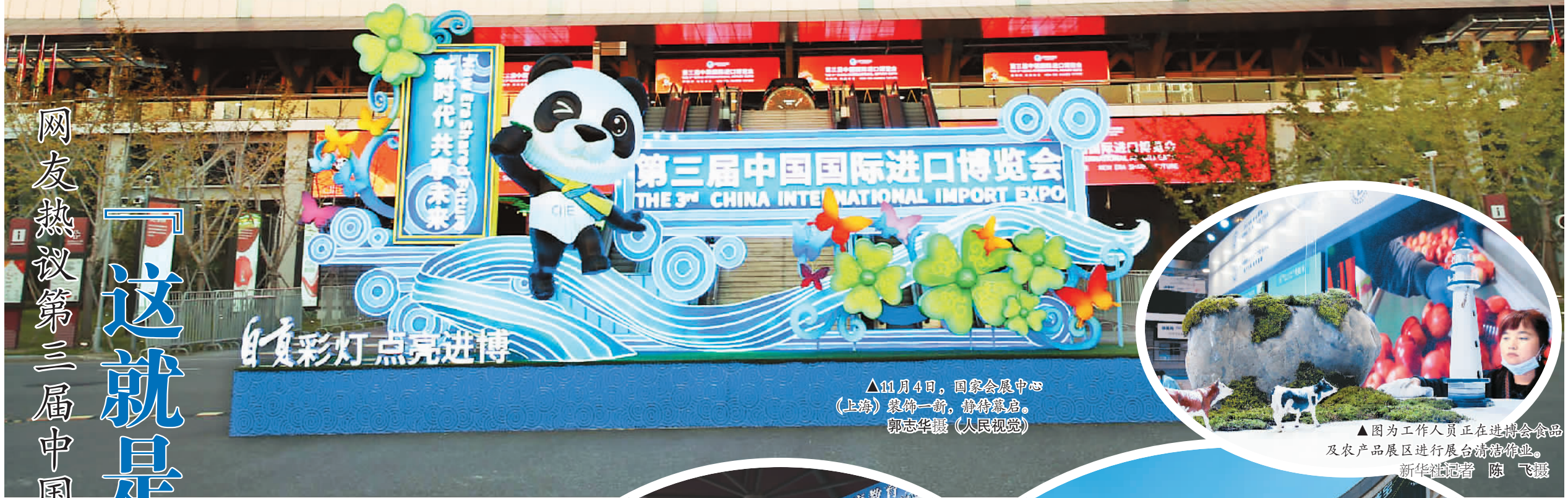
▲11月4日，国家会展中心（上海）装饰一新，静待开幕。

“这就是开放不止步的中国。”11月4日，人民日报法人微博发出这样一条动态。“‘不一般’的进博会，已成为中国推动开放合作的一张亮丽名片，成为中国改革不停顿、开放不止步的生动展示。新时代，共享未来，一起期待！”