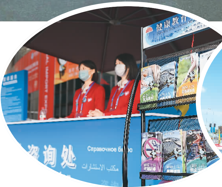
▲11月3日，志愿者在国家会展中心（上海）咨询处工作。