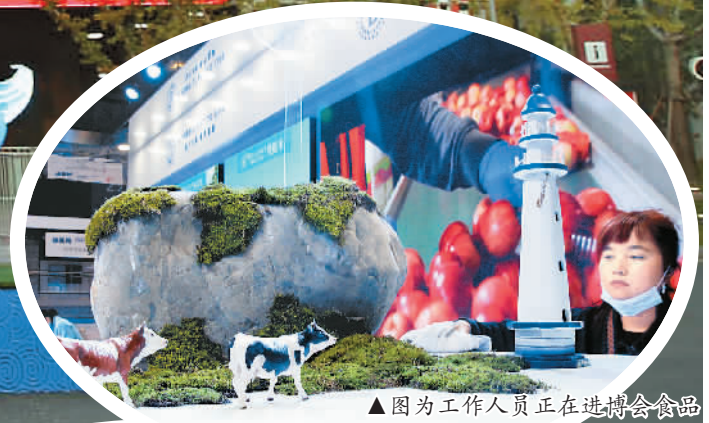
▲因为工作人员正在进博会食品及农产品展区进行展台清洁作业。