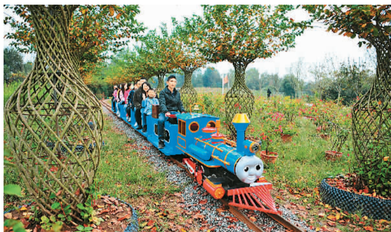
在湖北宜昌一农业休闲点，游客乘小火车体验穿越坡道、草坪、花海等自然模拟场景的乐趣。

在传统旅游目的地丽江，文化正在回归古城。感受“世界唯一活着的象形文字”东巴文的神秘魅力、欣赏纳西古乐、“看100岁的老人，用200年的乐器，演奏700年的乐曲”、体验纳西马帮文化等，已成为丽江古城的文化招牌，吸引了更多新游客，留住“回头客”。