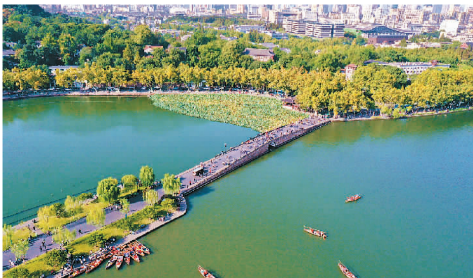
杭州西湖秋意渐浓，游客在西湖景区饱览秋色。

这些故事注定会让西湖的烟雨多几分味道。刚刚还是阳光明媚，不知是谁惹了天公，天色一下子阴沉下来。江南的烟雨就是这样，来得快，去得也快。下起来稠稠密密，缠缠绵绵；说不了，天公立刻绽放笑脸，多情而善变。所以，杭州人出门总是要先看天色，带上一把雨伞，尤其是那些花纸伞，五颜六色，散落在西湖边的人行道上，平添了几分妩媚。杭州人告诉我，西湖的烟雨总会给人留下几分惆怅。对岸的雷峰塔下