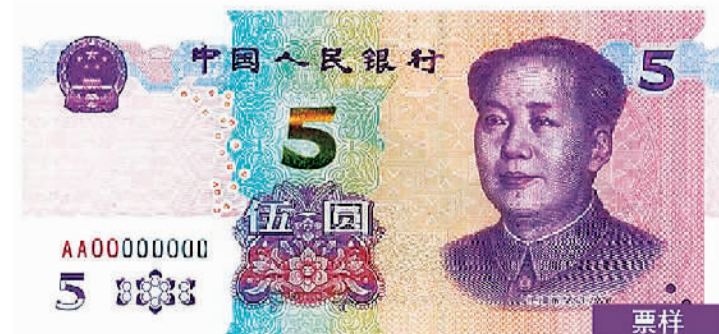
▲正面：中部面额数字调整为光彩光变面额数字“5”；左下角和右上角局部图案调整为凹印对印面额数字与凹印对印图案；左侧增加装饰纹样，调整面额数字白水印的位置，调整左侧花卉水印、左侧横号码、中部装饰团花、右侧毛泽东头像的样式；取消中部全息磁性开窗安全线和右侧凹印手感线。 边纪红制（新华社发）

新版5元纸币的防伪技术和印制质量在多个方面进行了提升，与2019年版第五套人民币50元、20元、10元、1元纸币和2015年版100元纸币的防伪技术及其布局形成系列化。