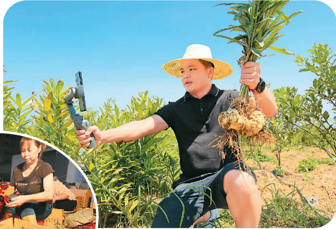
图①：在广西柳城县，电商通过手机直播形式向客户推介生鲜复合产品。

随着疫情防控形势的稳定与经济社会活动的持续恢复，线下生鲜市场逐渐吸引消费回流。那么，对喜爱生鲜食材的人来说，究竟是去市场现场挑选好，还是完全信赖电商平台？两种渠道的发展呈现哪些新特征？对此，笔者进行了走访。