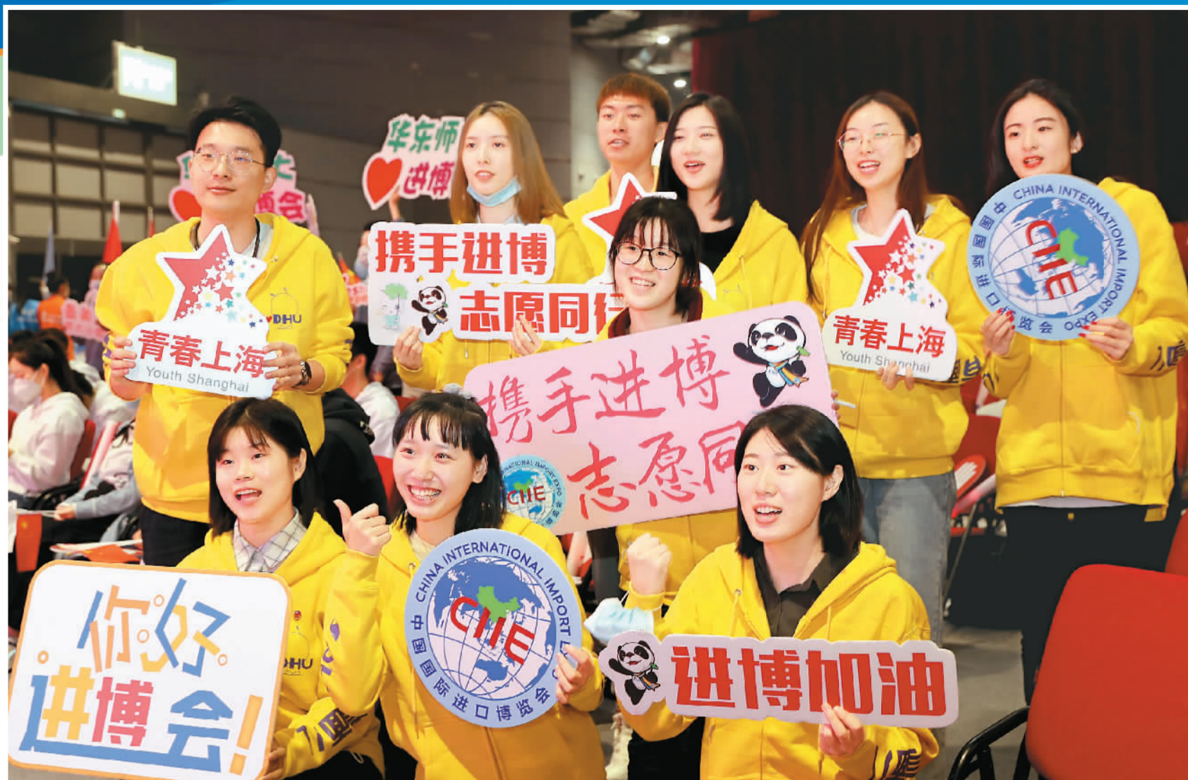
▲ 据介绍，截至目前，第三届进博会已招募4844名志愿者。将有3700多名志愿者在现场引导咨询、联络接待、新闻宣传、展会注册、迎送保障、数据统计、行政保障、医疗应急救援、防疫健康宣传等岗位服务。图为来自东华大学的志愿者代表在宣誓上岗仪式后合影留念。

“要拿出特殊精神、特殊作为，朝着更高目标努力，坚持更高标准不变。”作为第三届进博会的举办地，上海全力以赴、精益求精，扎实做好城市服务保障各项工作，正张开热情又令人安心的双臂，全力以赴举办一场安全、精彩、富有成效的盛会。