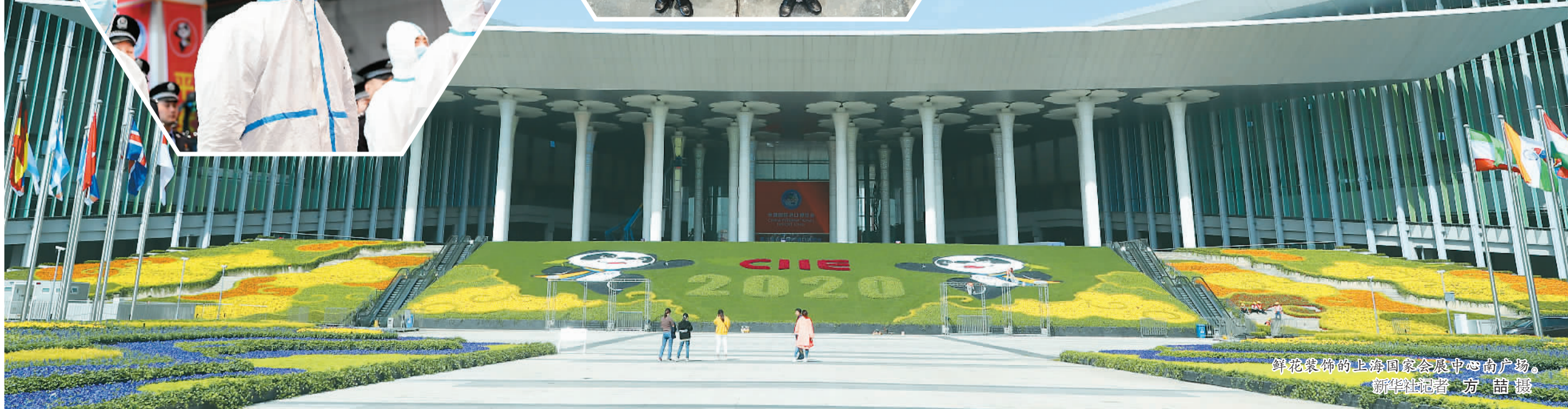
鲜花装饰的上海国家会展中心南广场。