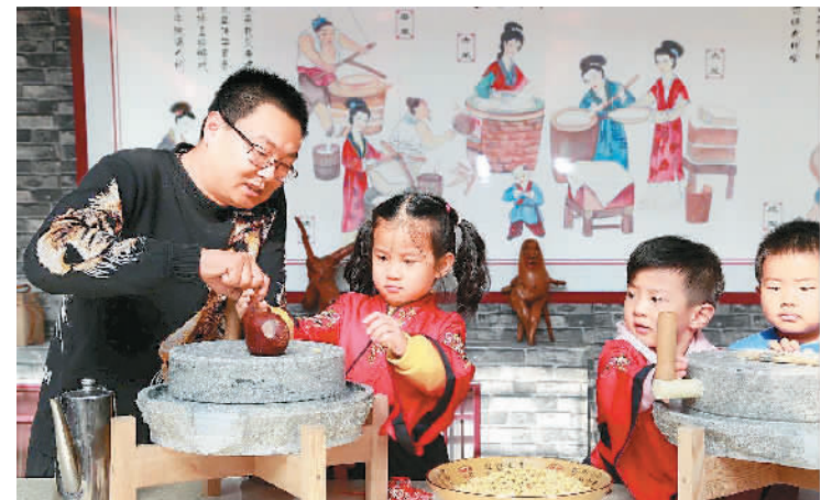
DIY豆腐工坊制作酸浆豆腐