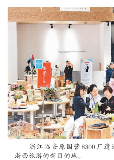
浙江临安原国营8300厂遗址被打造成工业遗址保护的新案例、浙西旅游的新目的地。