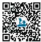
欢迎关注本版微信公众号“人民日报天下”

“不求所有,但求所用。”淳安县县委负责人说,在实现全面小康和特别生态功能区建设过程中,淳安对人才的渴求前所未有。接下来,淳安县将通过多种“柔性引才”,为生态保护和绿色发展提供“智力保障”,让绿色小康之路越走越宽。