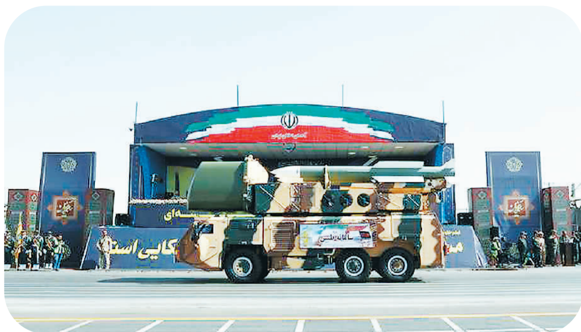
2019年9月22日，伊朗举行阅兵式。

对于伊朗而言，10月18日是不同寻常的一天。这一天，虽遭遇了美国的百般阻挠，联合国对伊朗武器禁运如期终止。专家认为，这意味着伊朗对美外交的胜利，从长期来看也有助于伊朗恢复其作为正常国家的地区和国际地位。而且，在国际多边主义遭遇单边主义挑战的当下，这也突显了国际社会维护多边主义的决心和意志。不过，美国仍然不依不饶，单方面维持对伊朗的高压政策，给地区局势增添了不确定性。