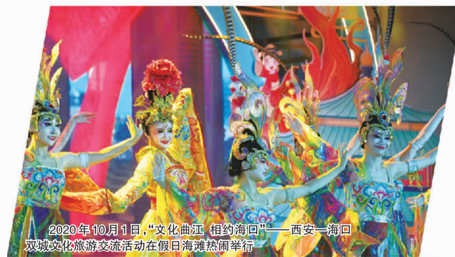
2020年10月1日,“文化曲江 相约海口”——西安—海口双城文化旅游交流活动在假日海滩热闹举行