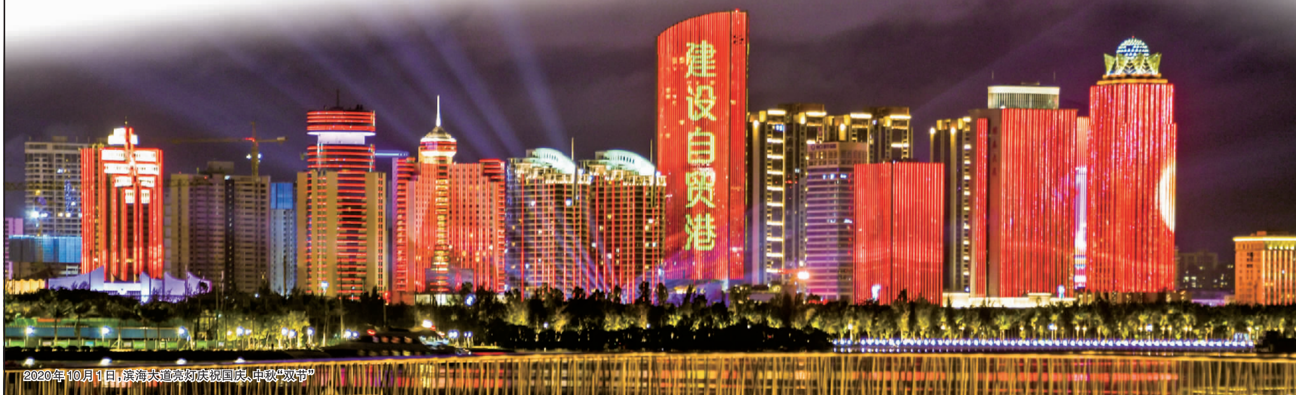
2020年10月1日,滨海大道亮灯庆祝国庆、中秋“双节”