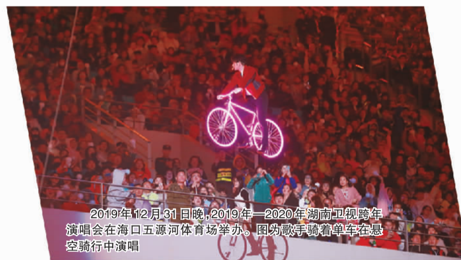
2019年12月31日晚,2019—2020湖南卫视跨年演唱会在海口五源河体育场举办。图为歌手骑着单车在悬空骑行中演唱