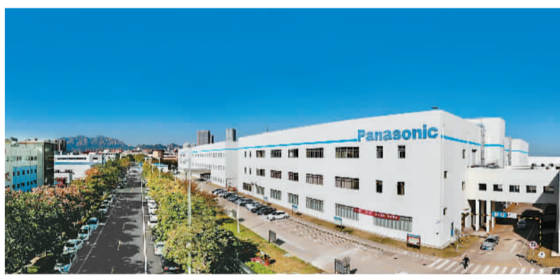
青岛松下电子部品有限公司。

近3个月以来，青岛市各部门密切配合，在疫情防控常态化下，完成了7架中德“快捷通道”包机服务保障任务，累计运载9家机构、286家企业共1635名外籍高管、专家、员工及家属从青岛出入境，未发现一例核酸阳性病例，搭建起了疫情下中德两国经贸人文往来的“空中走廊”。此举得到了包括德国驻华大使以及戴姆勒、大众、西门子等企业高管和众多德国经济界、工商界人士的赞誉。