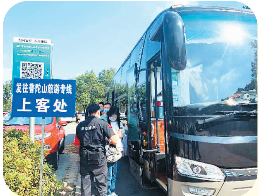
游客在奉化溪口镇雪窦山停靠站乘坐前往普陀山旅游专线。