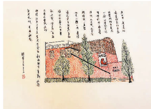
上为老书虫，下为布衣书局