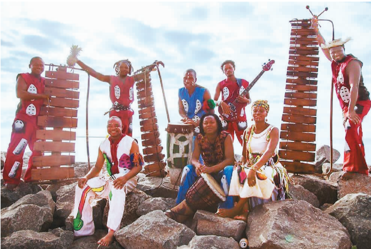
莫桑比克青年在演奏缇姆比拉木琴。