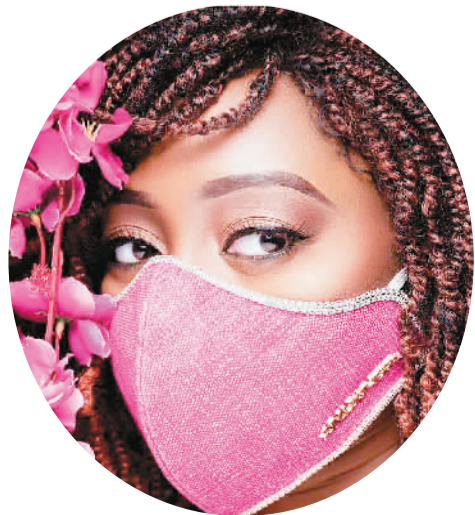
莫桑比克人设计的口罩

采访当天我们以介绍莫桑比克口罩为主题制作的短视频一经发布，迅速引来网友点击，播放量超过100万。网友们纷纷留言点赞：“真的好看”“这个创意可以打满分”“喜欢这种设计理念”。