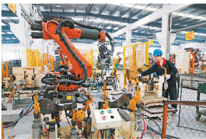
目前，重庆“智能制造”吸引了众多工业互联网平台落户。图为重庆市北碚区正能机械有限公司内，机器人的生产数据将全部汇总至车间工业互联网“驾驶舱”。

加速发展，发挥战略性新兴产业的引擎作用尤为重要。据国家发改委相关负责人介绍，在广泛征求50多个部门和地方的意见建议的基础上，《意见》提出了扩大战略性新兴产业投资、培育壮大新增长点增长极的20个重点方向和支持政策，致力推动战略性新兴产业高质量发展。