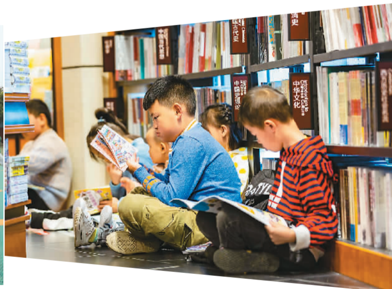
▲ 双节期间，不少市民来到书店看书、购买书籍，在感受知识魅力的同时，享受假期时光。图为小朋友在贵州省安顺市西秀区一家书店内阅读。