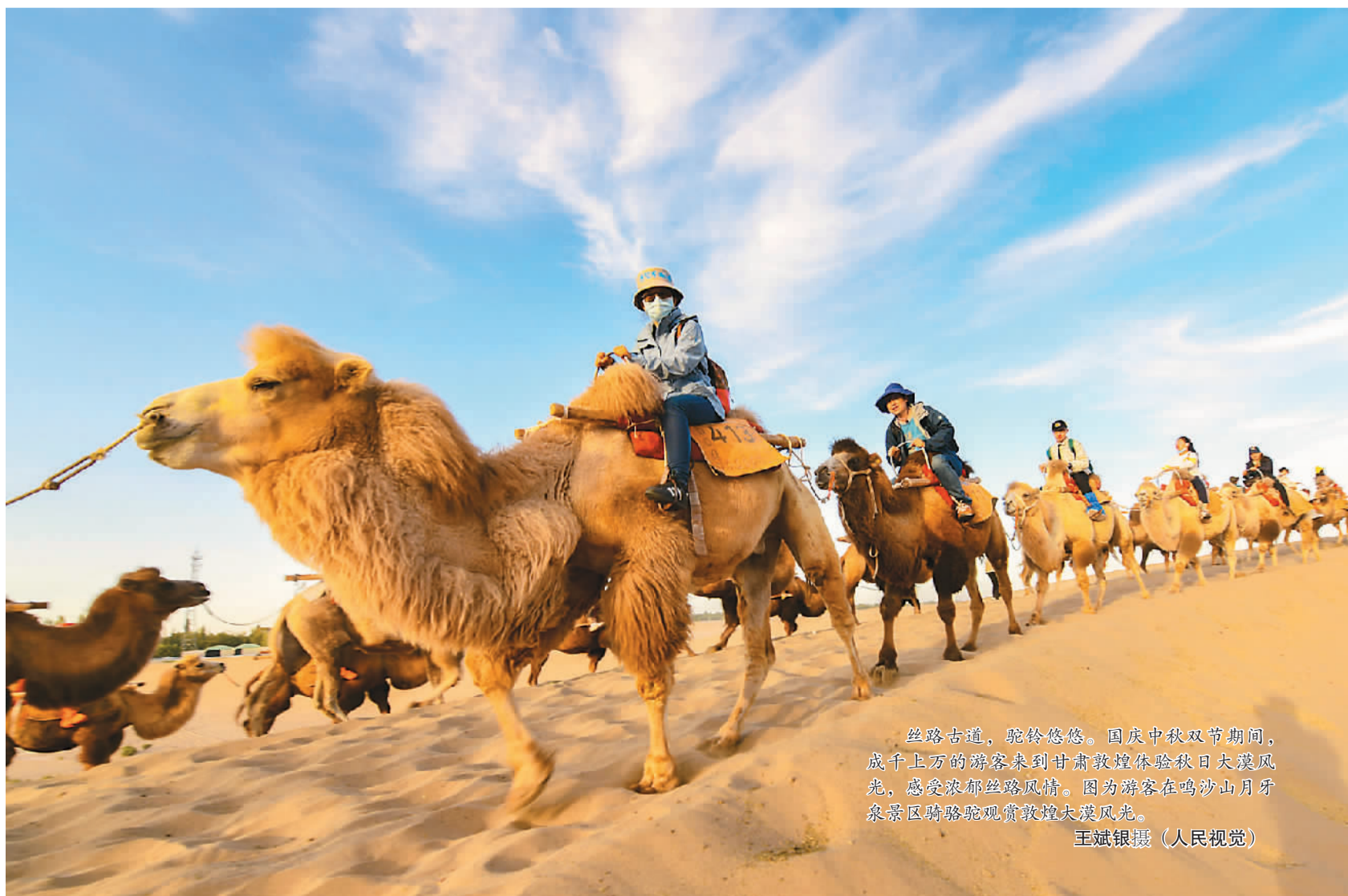
丝路古道，驼铃悠悠。国庆中秋双节期间，成千上万的游客来到甘肃敦煌体验秋日大漠风光，感受浓郁丝路风情。图为游客在鸣沙山月牙泉景区骑骆驼观赏敦煌大漠风光。