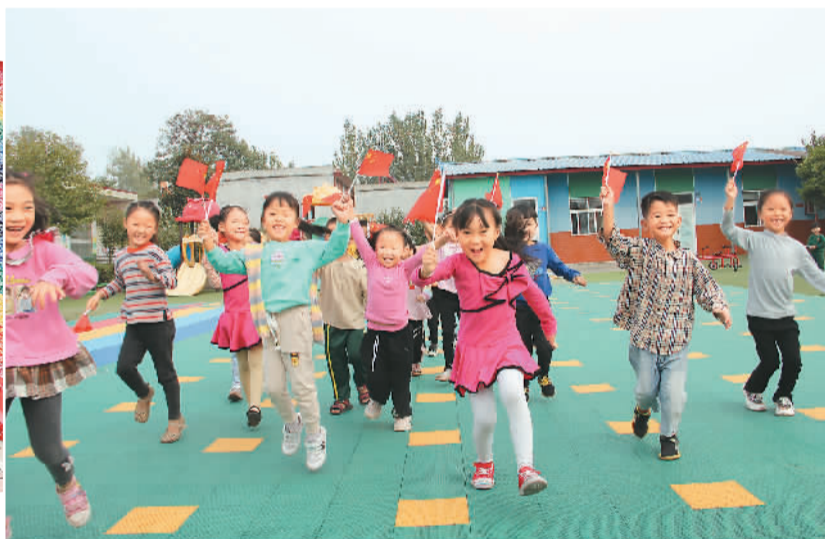
▲ 节日期间，河南省襄城县为留守儿童举办丰富多彩的活动，让孩子们过上一个温暖假期。图为襄城县湛北乡首山古庄艺术幼儿园，孩子们欢腾跳跃庆祝祖国71华诞。