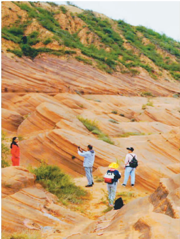
▼ 陕北靖边龙洲镇波浪谷“水上丹霞”，不仅有线谷、巷谷、绝壁等众多地质地貌，还有溪流、沙地、芦苇荡等自然资源，吸引了众多游客来此打卡游玩。图为假日期间武汉游客在此拍照留念。