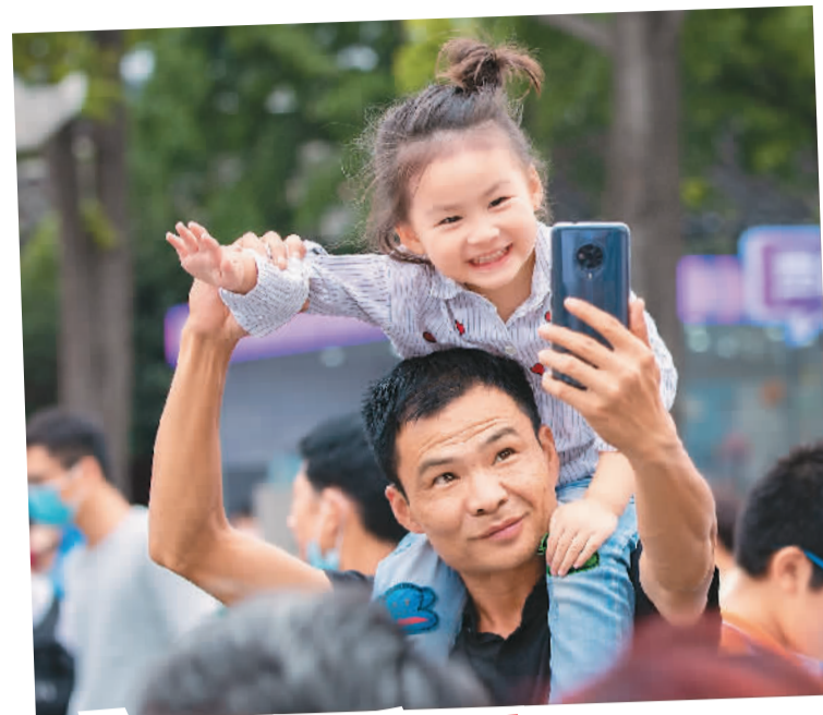
◀ 长假期间，江苏南京夫子庙景区游人如织。图为一对父女在自拍，给孩子记录成长时光。