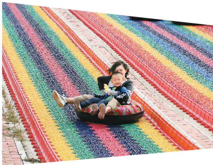
▲ 山东省东营市东营区文汇街道万象游乐园，游客体验彩虹滑道游乐项目。