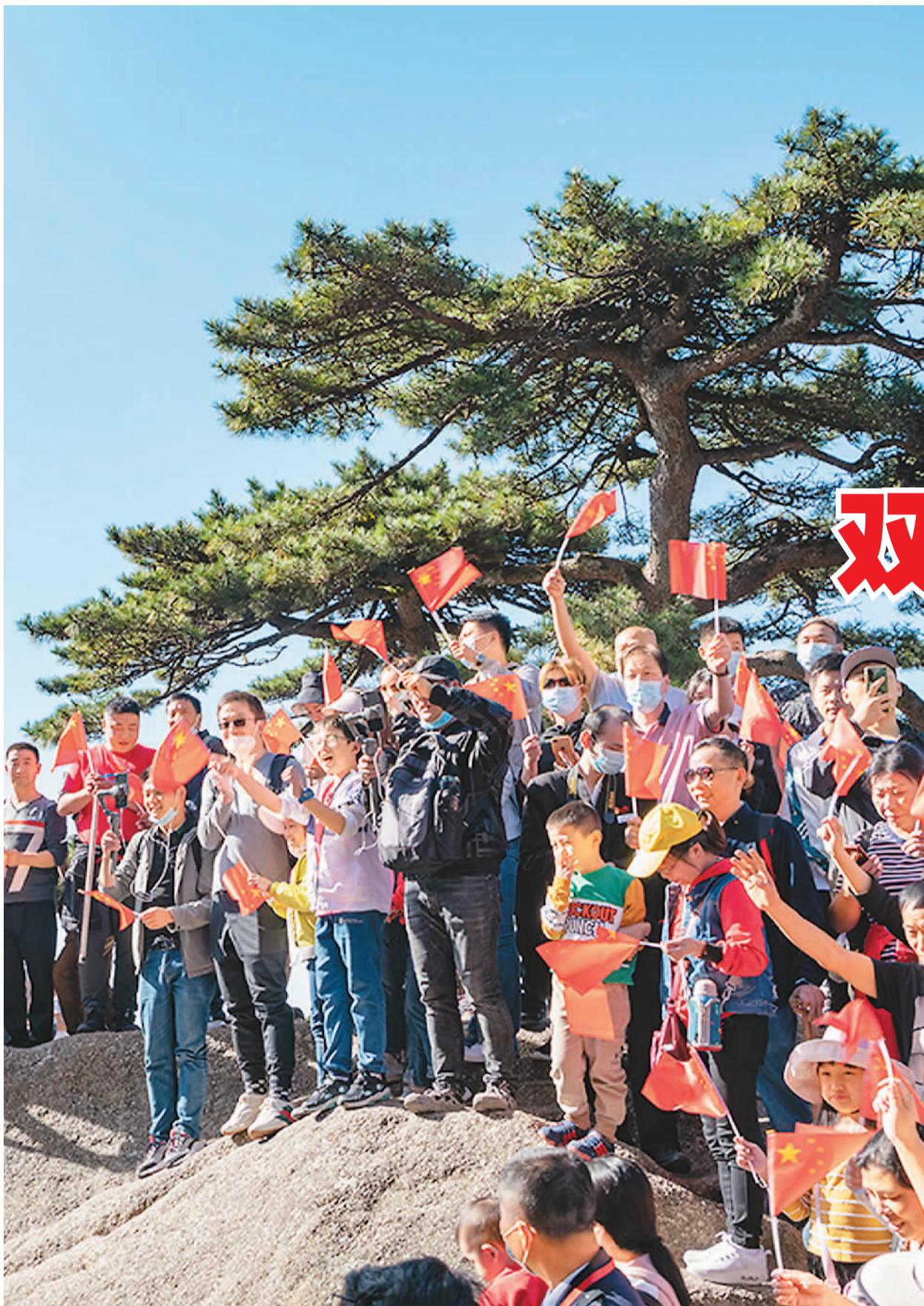
◀ 国庆长假首日，黄山风景区天气晴好。玉屏楼迎客松前举行升旗仪式，游客手持国旗拍照留念。