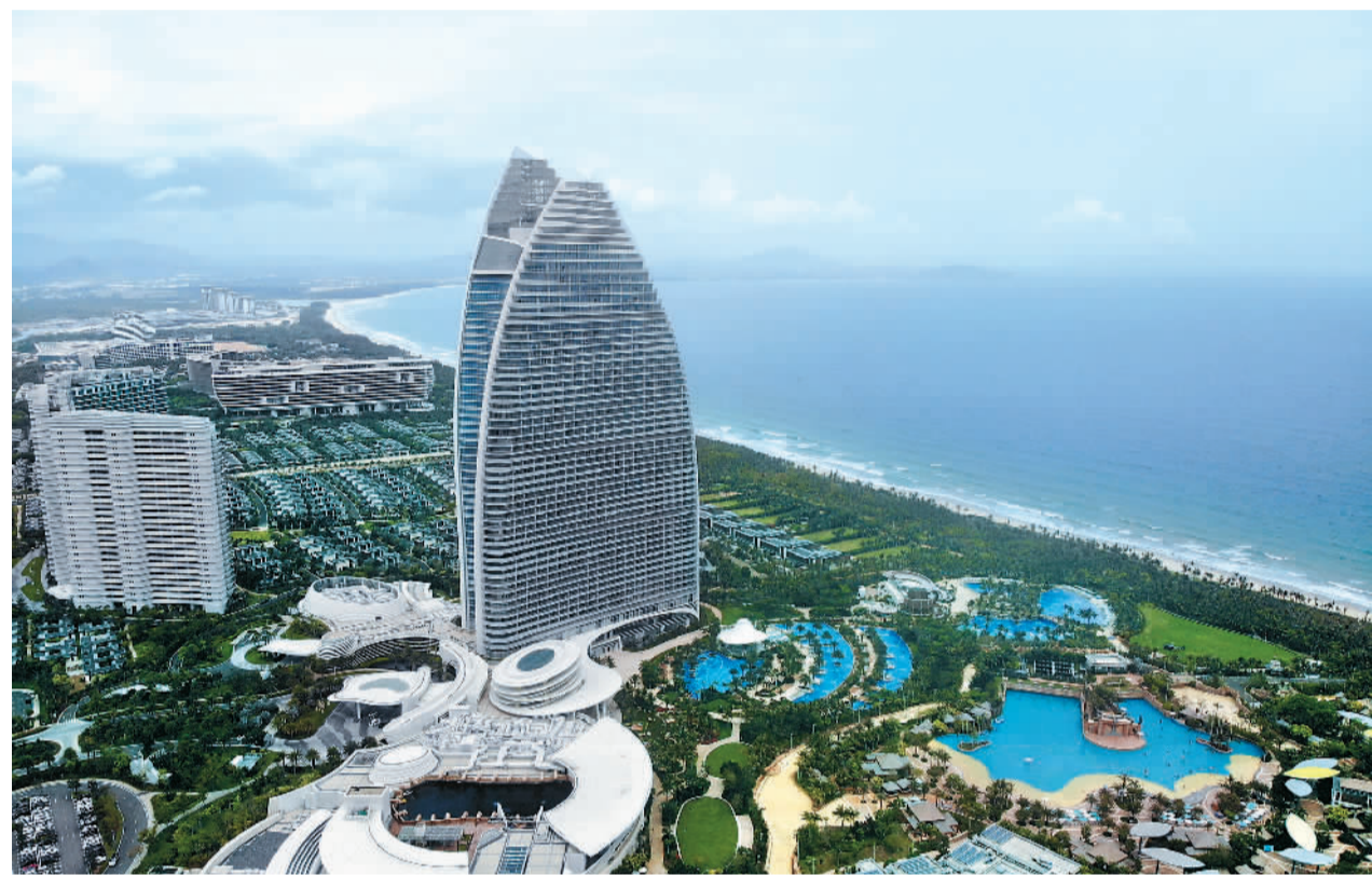
海南三亚的亚特兰蒂斯度假区