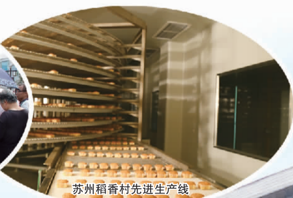
苏州稻香村先进生产线