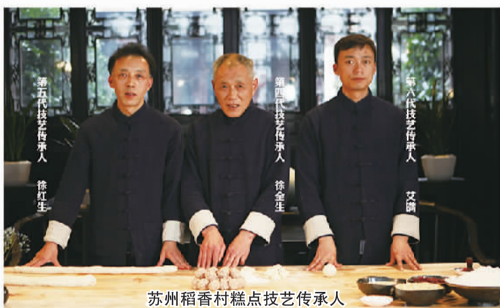
苏州稻香村糕点技艺传承人

苏州稻香村拥有120余条国内外先进的现代化生产线,并先后通过QS、HACCP、ISO9001等多项认证。十万级空气净化生产车间,生产过程全程监控、全方位透明化无菌生产、国际先进的生产设备与工艺与科学管理体系,使苏州稻香村的悠久文化与现代加工技术融为一体。苏州