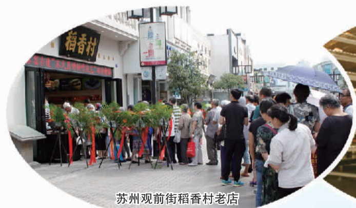
苏州观前街稻香村老店