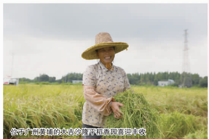
位于广州黄埔的大吉沙隆平稻香园喜迎丰收

体现了机械之美。这些机械都将投入到大吉沙稻香园的农业生产中，为黄埔区农业事业发展贡献力量。