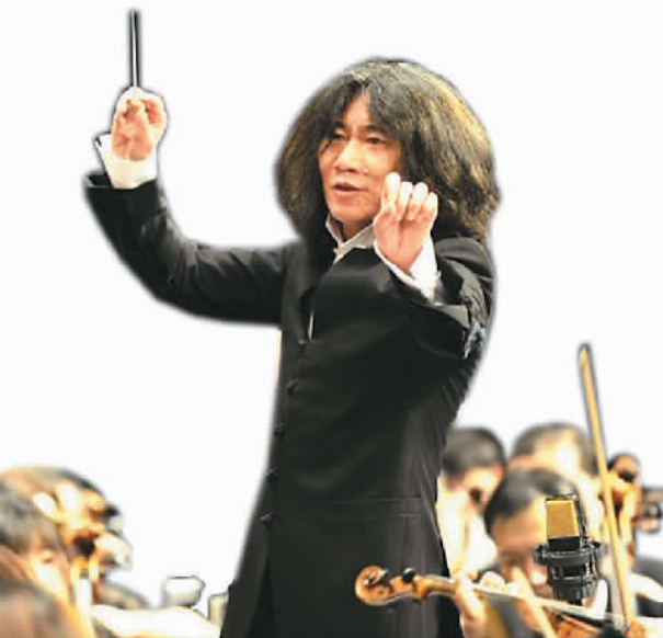
交响音乐会《黄河回响》

10年来，很多年轻导演从年度表彰大会中脱颖而出，成为中国电影的新力量。李少红透露，为了帮助年轻而有才华的导演出头，导演协会甚至修改过评选章程。她也希望通过中国电影导演协会这片沃土培养更多的年轻人才。她发起的“青葱计划”如今已经举办了5届，共选了25个项目，到今年前4届拍摄完成的影片已有十几部，“我们每年发掘5位新人导演，10年后就能为中国电影培养一大批影坛生力军。”