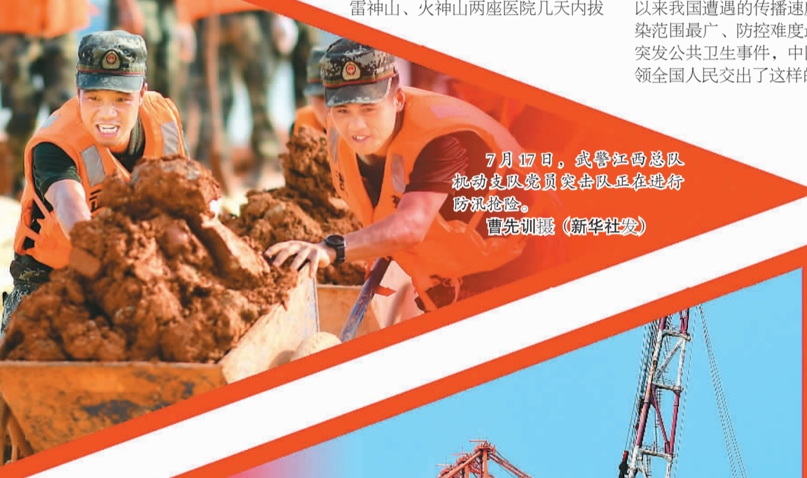
7月17日，武警江西总队机动支队党员突击队正在进行防汛抢险。