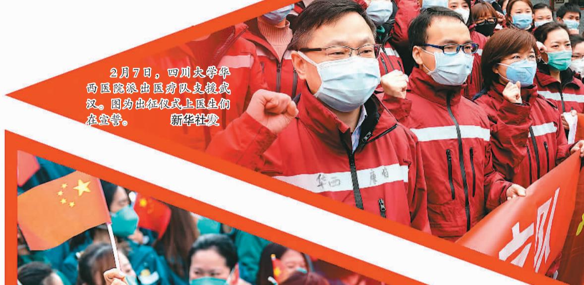
2月7日，四川大学华西医院派出医疗队支援武汉。图为出征仪式上医生们在宣誓。

面对百年来全球发生的最严重的传染病大流行，面对新中国成立以来我国遭遇的传播速度最快、感染范围最广、防控难度最大的重大突发公共卫生事件，中国共产党带领全国人民交出了这样的答卷。