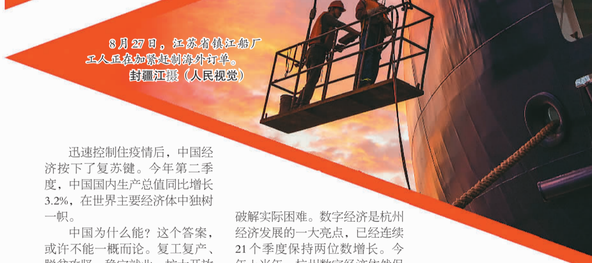
8月27日，江苏省镇江船厂工人正在加紧赶制海外订单。