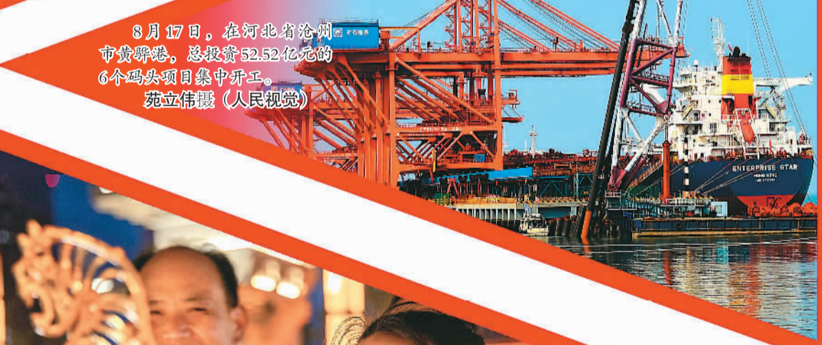
8月17日，在河北省沧州市黄骅港，总投资52.52亿元的6个码头项目集中开工。