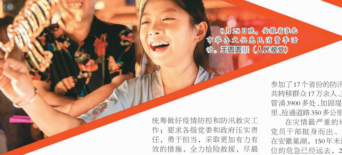
8月28日晚，安徽省淮北市举办文化惠民消费季活动。