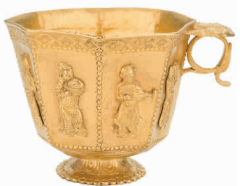
唐代伎乐纹八棱金杯，新加坡亚洲文明博物馆藏

为纪念中新建交30周年，由上海博物馆与新加坡亚洲文明博物馆联合举办的“宝历风物——黑石号沉船出水珍品展”近日在上海博物馆开幕。展览共展出248件/组文物，其中包括新加坡亚洲文明博物馆邱德拔展厅精选的“黑石号”沉船出水珍品168件以及来自上海博物馆与国内9家文博单位的