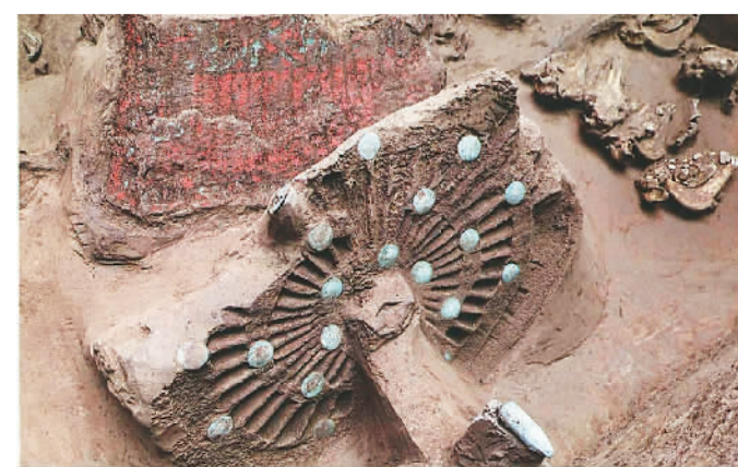
甘肃漳县墩台墓地随葬马车