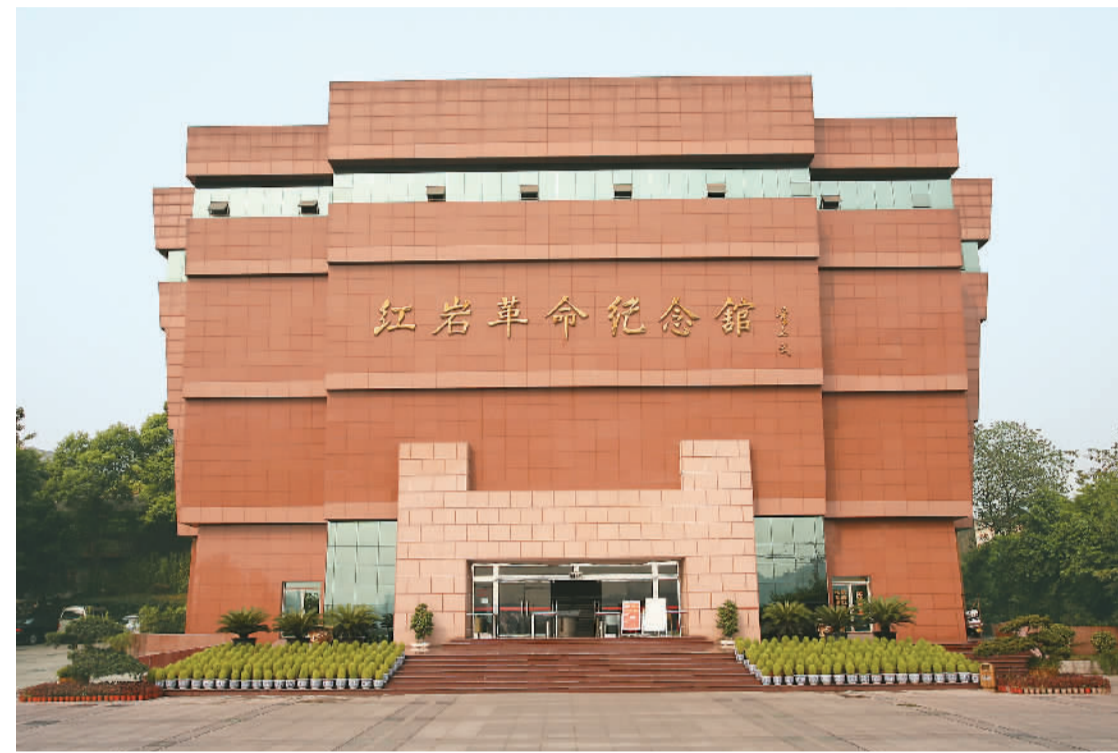
红岩革命纪念馆外观