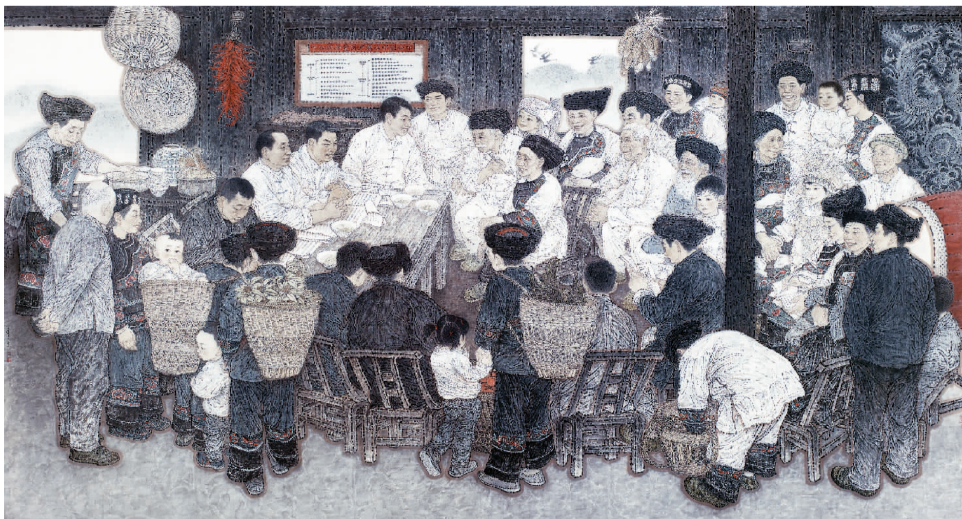
暖心——十八洞村贫困户精准识别公示会（中国画） 王奋英