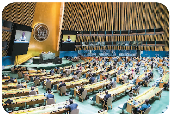
图为9月11日在位于纽约的联合国总部拍摄的联合国大会全体会议现场。