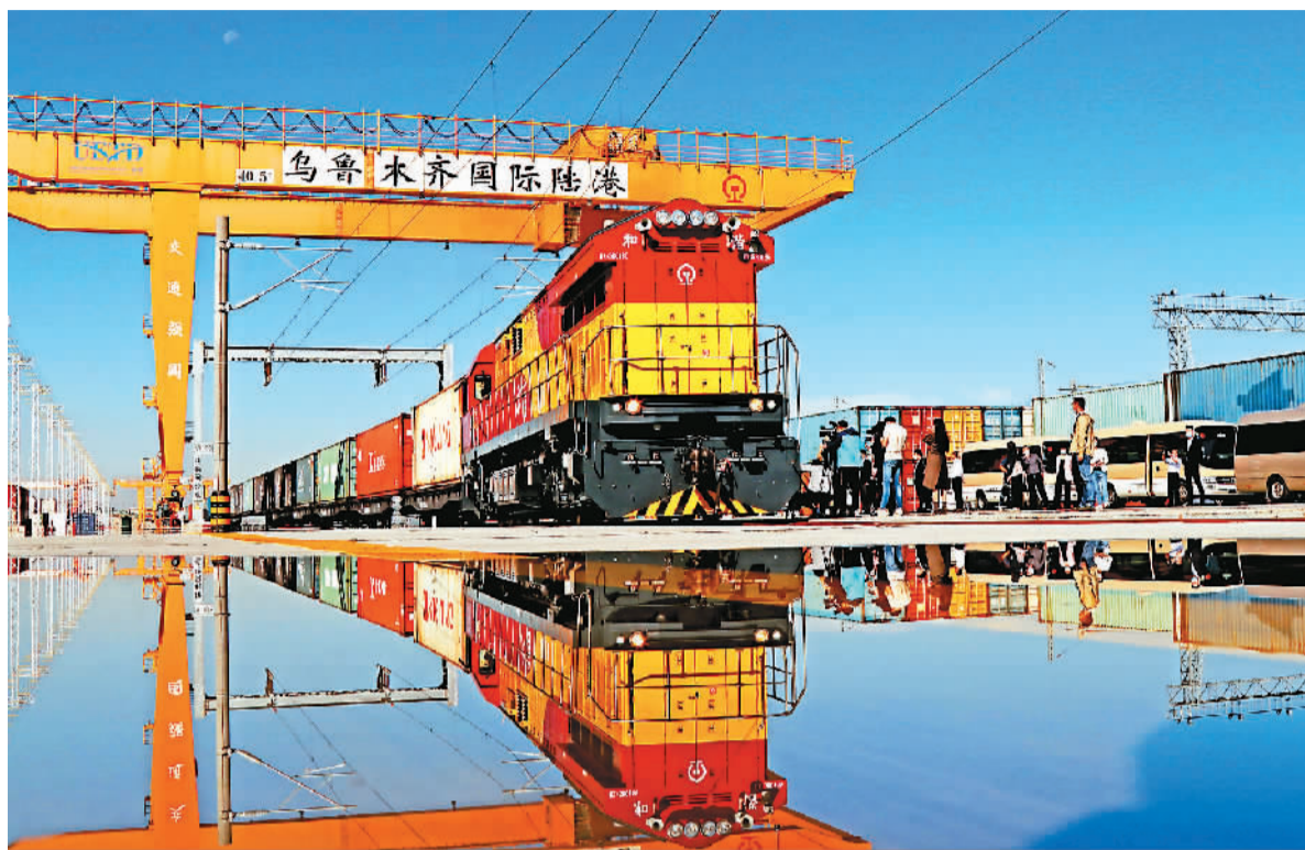
图为中欧班列。近年来，随着国家“一带一路”战略的实施，新疆乌鲁木齐国际陆港区建设步伐加快，陆港区各功能设施不断完善，中欧班列的开行密度逐渐增多，今年开行班列已突破600列。

“世界怎么了，人类将向何处去？和平发展之路该怎么走？”面对这一时代命题，中国主张各国人民同心协力，构建人类命运共同体，赢得了国际社会的广泛赞誉。