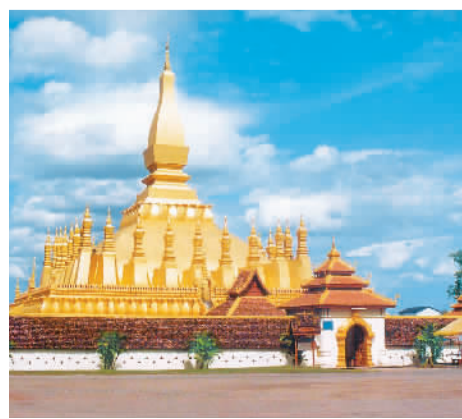
老挝万象塔銮。

热情友善的老挝人民、金碧辉煌的万象塔銮、风光旖旎的湄公河畔……到过老挝的游客，总有许多美好的“记忆点”。