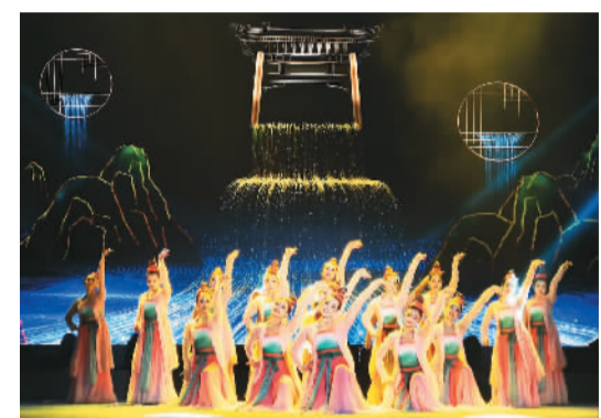
海外华文媒体一行在第二届大运河文化旅游博览会分会场暨第三届中国（淮安）大运河文化带城市非遗展开幕式现场观看表演《运河·织·河》。

深入参观采访后，海外华文媒体相关负责人纷纷表示，将综合运用多种形式报道大运河故事，充分挖掘侨元素，增强报道贴近性，让更多海外侨胞了解大运河文化，汇聚侨智侨力助推大运河文化带建设。