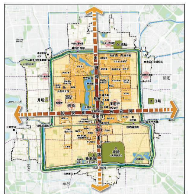
首都功能核心区空间结构规划图