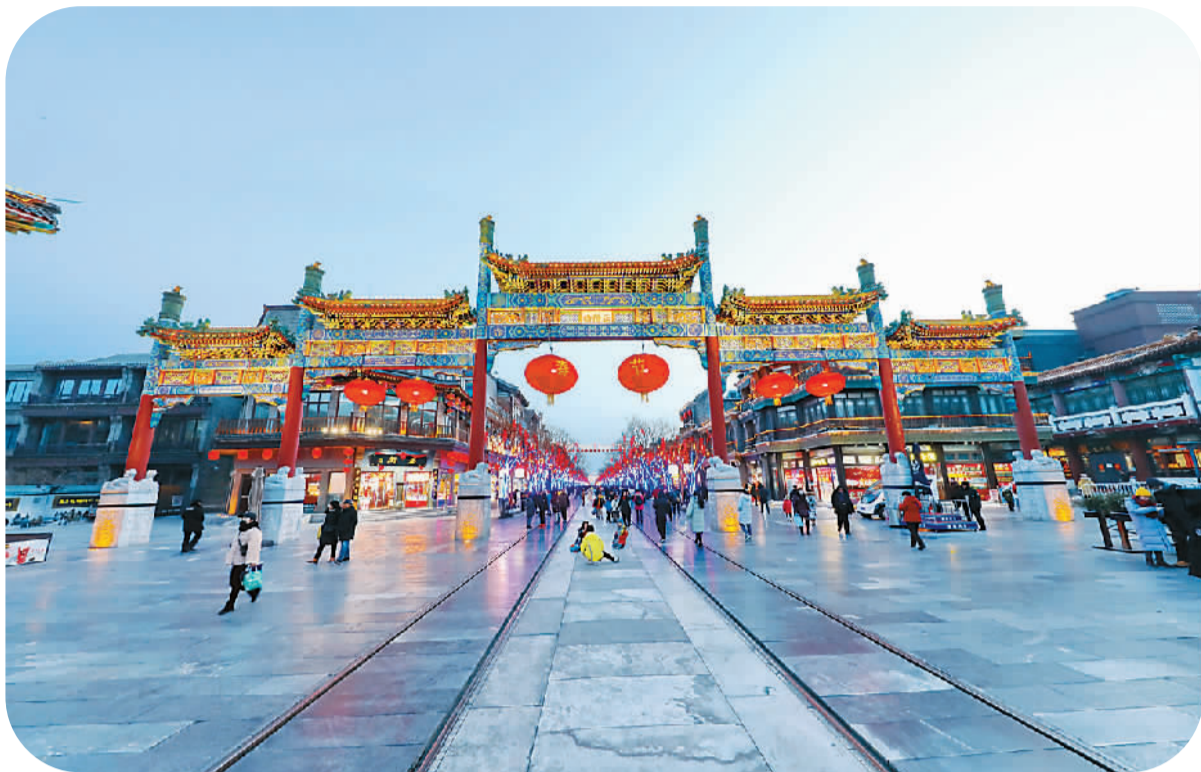
游人在北京前门大街游玩。