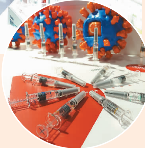
▲科兴中维研发的新冠灭活疫苗实物。