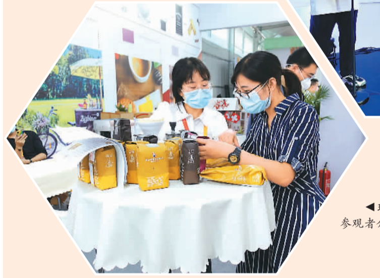
▲瑞士展台，工作人员正在向参观者介绍瑞士布莱泽咖啡豆。