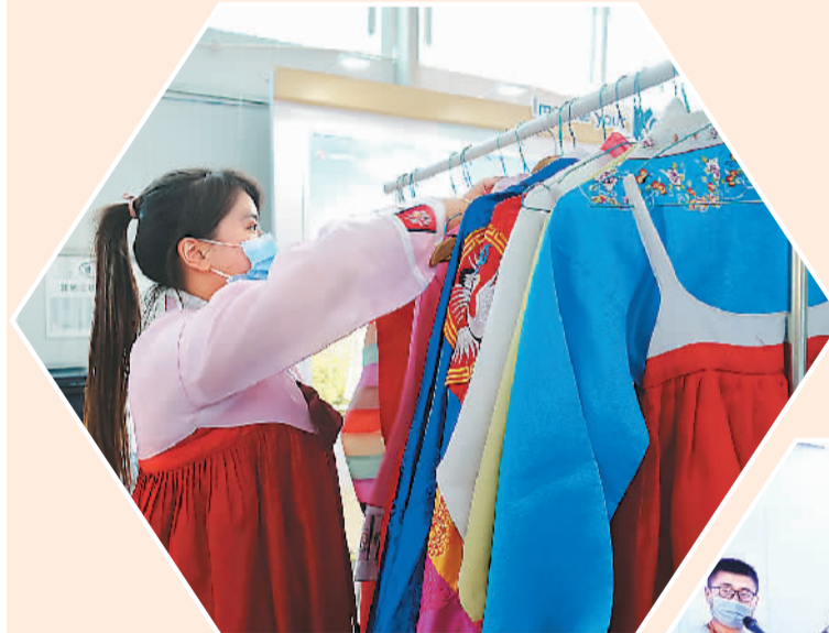
▲韩国展台，工作人员正在整理韩国传统服饰，供参观者免费试穿。