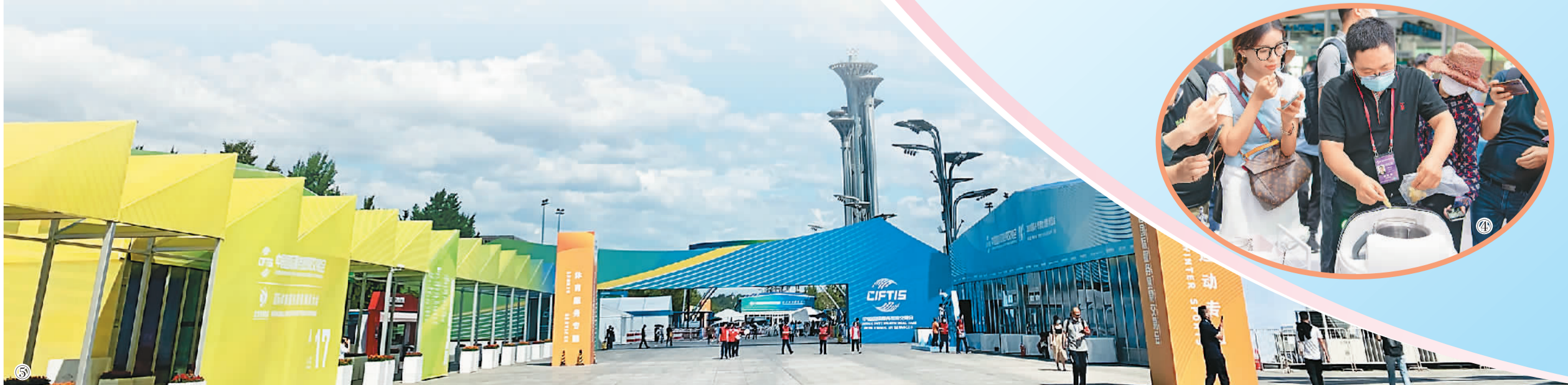
图⑤:服贸会展区外景。