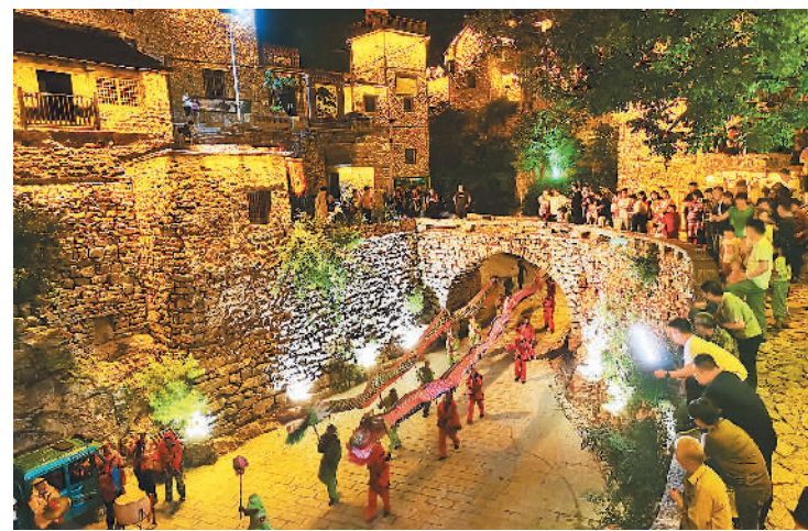
八月三十一日晚，游客在河北省涉县大洼村观看传统民俗表演。