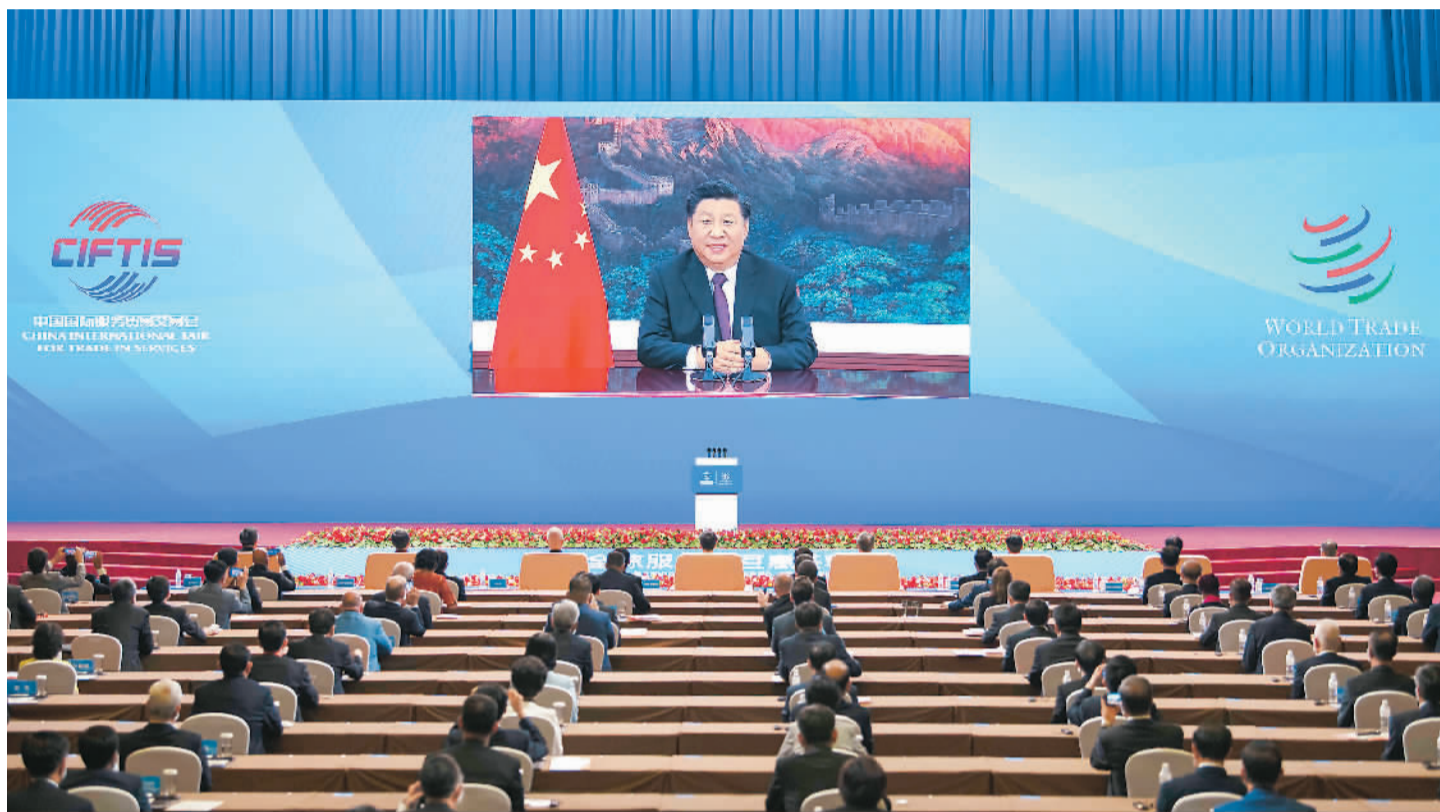
9月4日, 国家主席习近平在2020年中国国际服务贸易交易会全球服务贸易峰会上致辞。