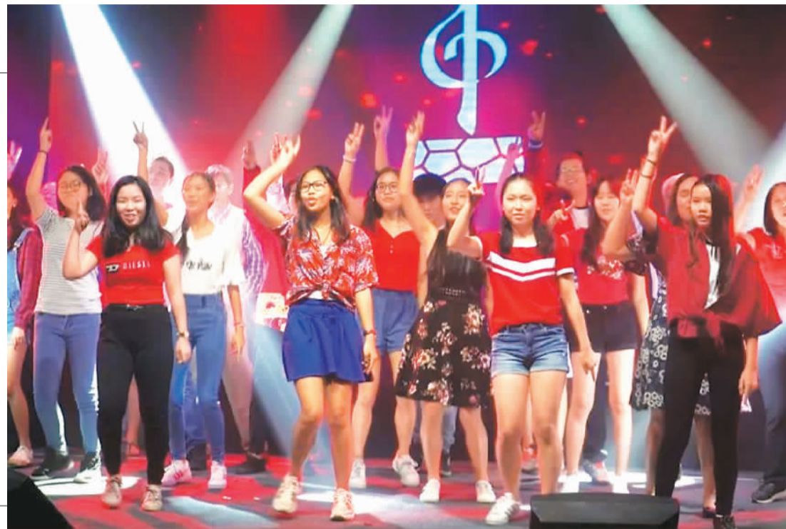
二〇二〇“文化中国·水立方杯”海外华人中文歌曲大赛毛里求斯赛区决赛现场。

自2011年以来，“水立方杯”大赛已走过10年。受新冠肺炎疫情影响，今年全球30多个国家50多个分赛区的选手都在线上完成报名、初赛以及复赛和决赛。9月6日至15日的复赛、9月16日至20日的决赛，将以海内外直播连线的形式进行。