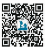
欢迎关注本版微信公众号“人民日报行天下”

《规定》让消费者在旅游过程中再遇到类似侵权行为时，有了维权武器。在外出游，能玩得更开心、更放心。而对于在线旅游经营者来说，这也是一次升级旅游服务、促进行业规范的良好机会。偌大的在线旅游市场，难免鱼龙混杂，如果缺乏约束与管理，不仅损害消费者权益，也将对行业自身造成负面影响，影响消费者对在线旅游业的信任度。在线旅游经营有法可依，才能防止劣币驱逐良币，净化行业环境，从而为消费者提供更好的旅游服务。