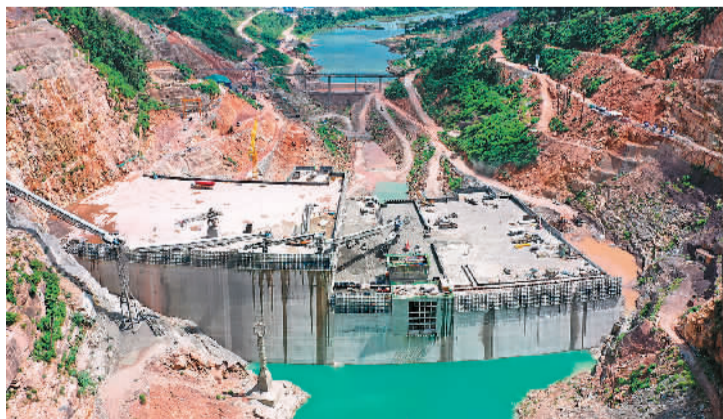
图为位于老挝中部波里坎塞省的中国电建水电三局南屯1水电站项目建筑工地。新冠肺炎疫情期间，中国建设者为打造欣欣向荣的澜沧江—湄公河流域经济发展带而日夜奋战。

当前，国际形势变化莫测，世界经济遭受严重冲击，逆全球化和保护主义逐渐抬头。澜湄合作是构建区域发展共同体重要环节，也是构建人类命运共同体和人类卫生健康共同体重要组成部分，符合时代发展的潮流和趋势。在此大背景下，流域各国更应充分发挥和发扬“同饮一江水”的地域优势和友好传统，顺应经济新形势，开辟合作新起点，不断谋求发展新动力，为区域发展和国际合作注入新活力。（姚慧采访整理）