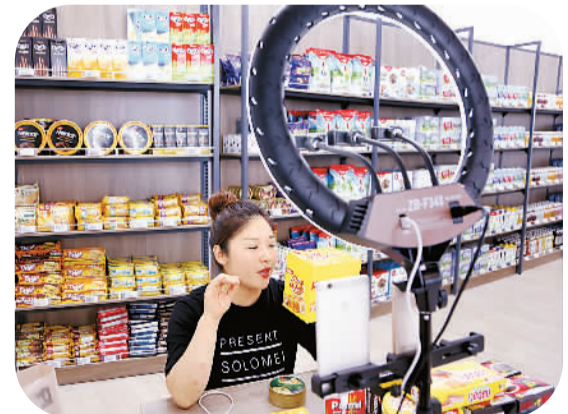
图为近日商家店员在江苏省连云港自贸区跨境电商体验中心通过网络直播推介商品。