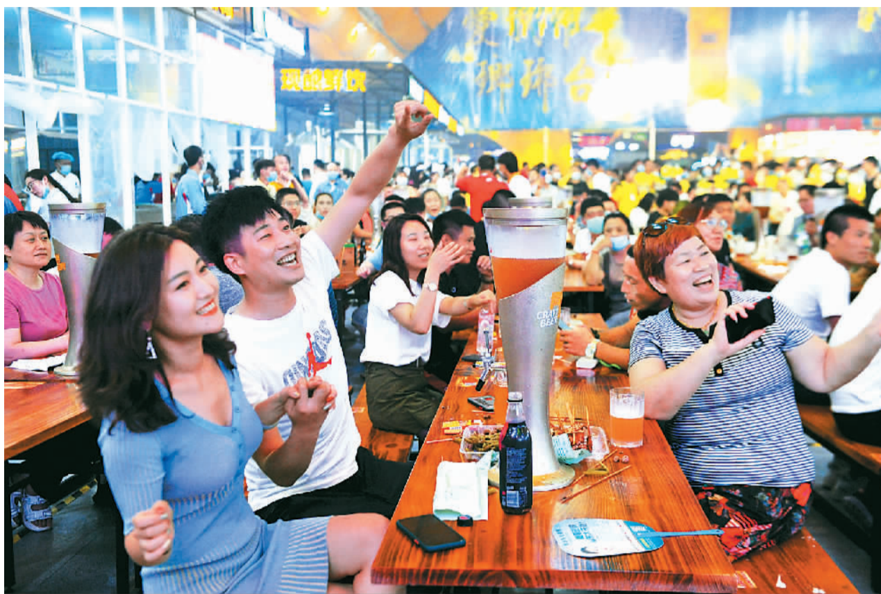
近日，山东青岛西海岸新区金沙湾啤酒城，市民和游客在啤酒大棚里喝啤酒，享受周末时光。