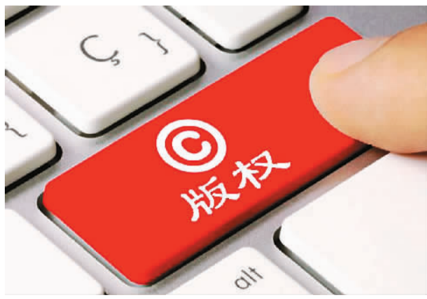
左图：第二届南京书博会“网络文学IP专区” 右图：数字内容版权亟待保护