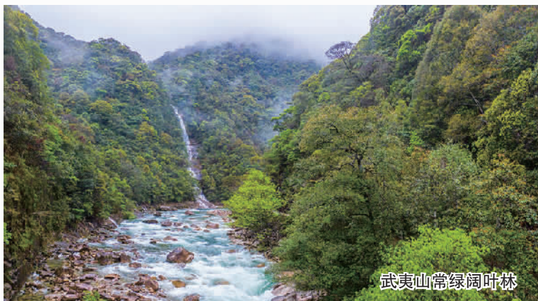
武夷山常绿阔叶林