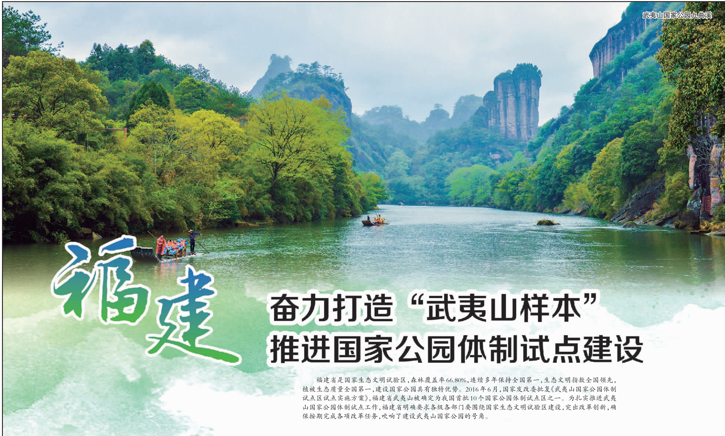
武夷山国家公园九曲溪