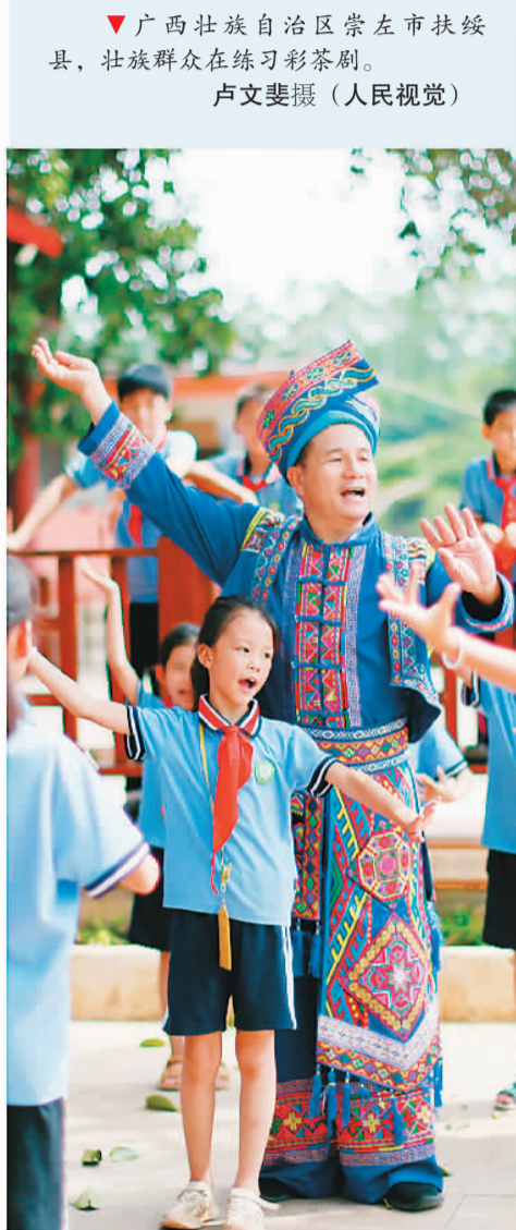
▼广西壮族自治区崇左市扶绥县，壮族群众在练习彩茶刷。