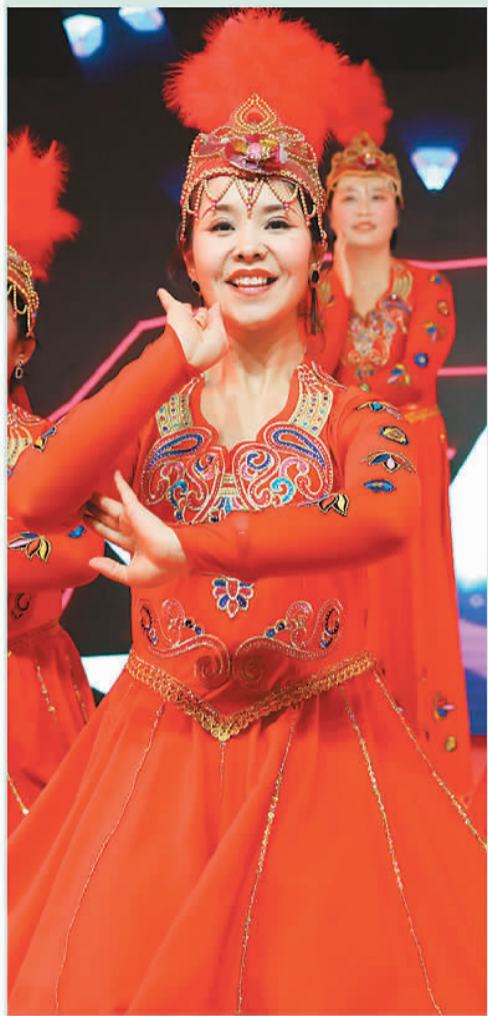
▲新疆乌苏，维吾尔族姑娘在表演舞蹈。

中国特色社会主义进入新时代，中华民族迎来了历史上最好的发展时期。一幅“同心共筑中国梦、民族团结石榴情”的壮阔画卷，正在神州大地上徐徐铺开。