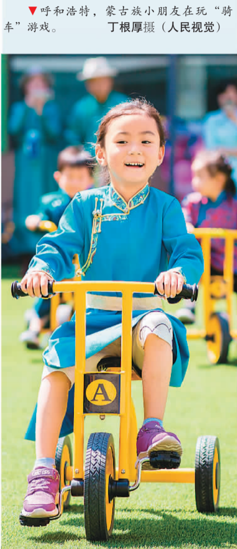
▼呼和浩特，蒙古族小朋友在玩“骑车”游戏。