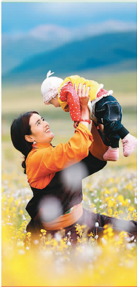
▲四川甘孜，一对藏族母子在连片的花海中嬉戏。