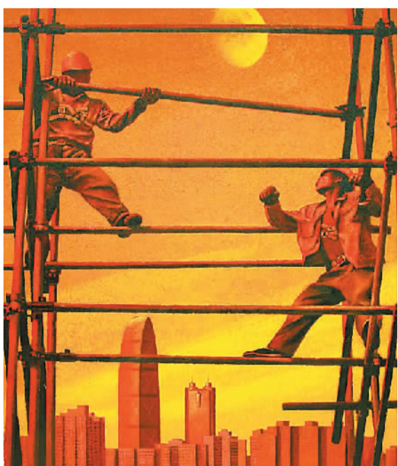
新的起点 (油画) 赵伟东