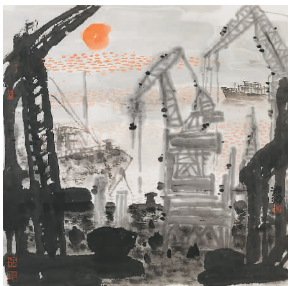
海港之晨·一 (中国画) 陈湘波