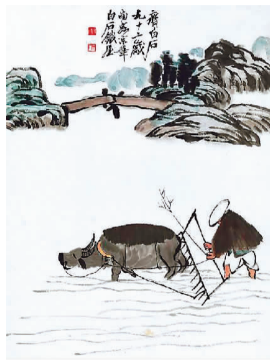
农耕图 (中国画) 齐白石