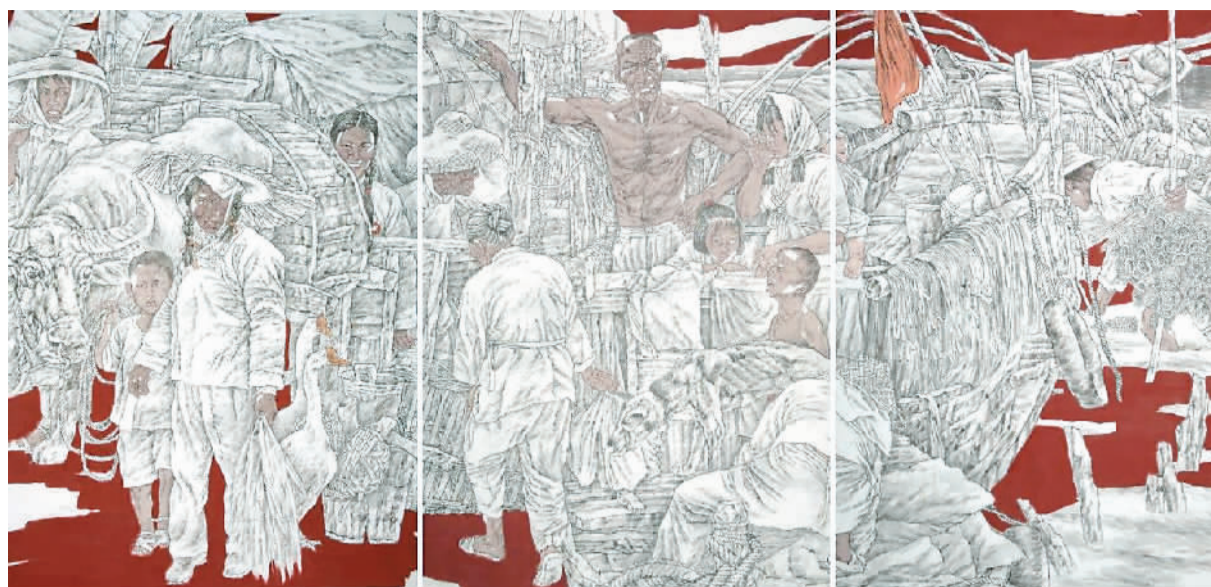
画说深圳 (局部) (中国画) 于长江