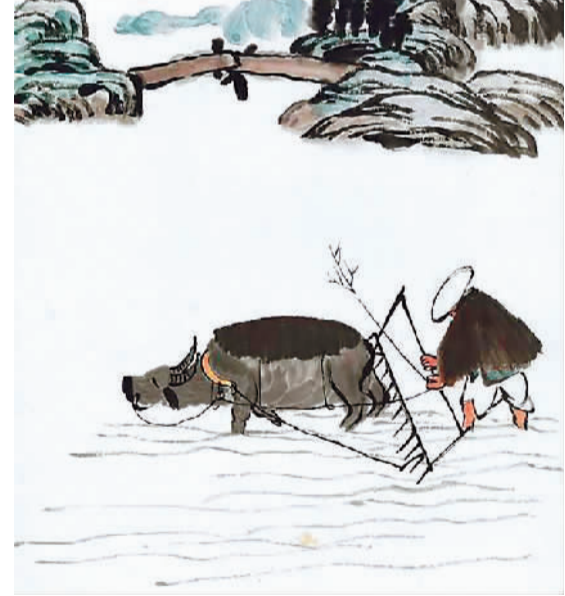
农耕图 (中国画) 齐白石