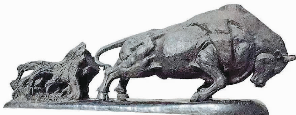
开荒牛 (雕塑) 潘鹤