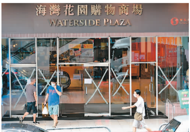
香港一处建筑对玻璃采取了防风措施（8月19日摄）。

据新华社香港8月19日电（记者朱宇轩、丁梓懿）19日凌晨开始，台风“海高斯”正面吹袭香港，香港天文台当日凌晨1时30分发出俗称“九号风球”的九号烈风或暴风风力增强信号。19日中午11时左右，“海高斯”集结在香港西北偏西约170公里，天文台改发三号强风信号，预计“海高斯”向西北或西北偏西移动，以约25公里的时速移向内陆并减弱。天文台表示，“海高斯”不再对香港构成威胁，并于下午1时20分取消所有热带气旋警告信号。