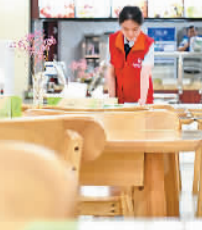
在安徽铜陵供电公司职工餐厅，工作人员在每张餐桌上摆放节约粮食的提示牌，提醒就餐者避免浪费食物。

在湖北武汉，餐饮业协会已向所有在汉餐厅发出了推广半份菜、准备打包盒的倡议。很多餐厅的食堂和外卖都推出了一份、半份、例份等规格，满足不同数量人群的就餐需求；在浙江宁波，几乎所有的餐饮店都会在醒目位置贴有“不剩饭、不剩菜”的提示，有的餐厅还推出“N-1”的点餐模式。