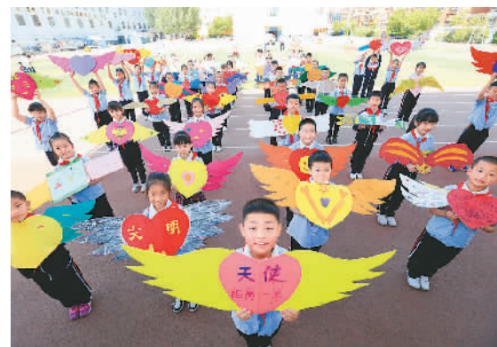
为确保自控力较弱的低年级学生入校后保持安全距离，内蒙古包头市包钢第二十四小学开设了“天使小翅膀 健康一米距”创意防疫课堂活动，用各种一米手工作品让学生保持间隔一米。图为孩子们展示设计的“一米翅膀”。