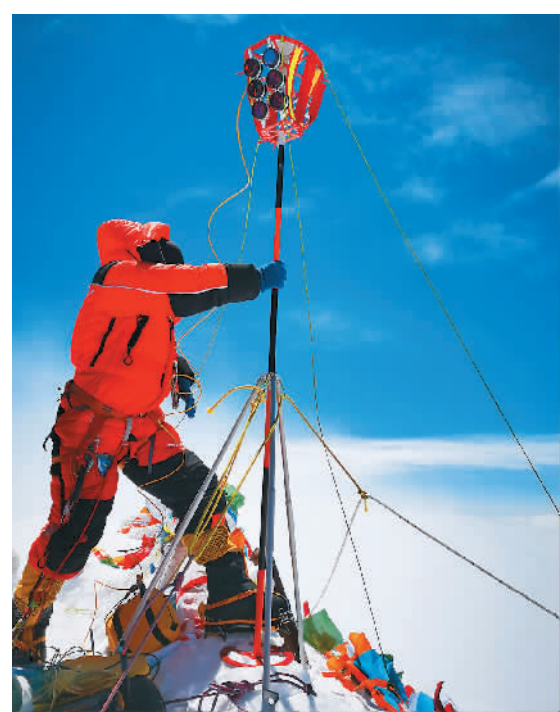
2020珠峰高程测量登山队队员在珠穆朗玛峰峰顶开展测量工作（2020年5月27日摄）。据自然资源部第一大地测量队队长李国鹏介绍，本次测量同时参考四大导航系统，并以北斗的数据为主。