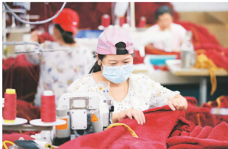
国家统计局数据显示，1—7月份，全国规模以上工业增加值同比下降0.4%，降幅比1—6月份收窄0.9个百分点。图为8月14日，工人在山东省青州市一规模企业生产车间内焊接作业。