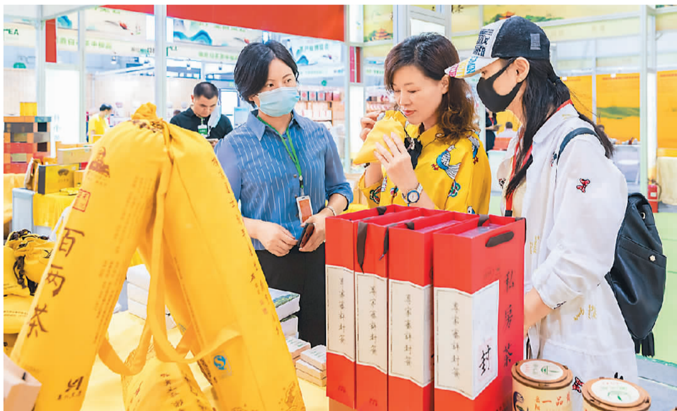
8月14日，为期4天的2020第八届中国（呼和浩特）茶产业博览会在位于呼和浩特的内蒙古国际会展中心开幕。本届茶博会以“香茗清幽 品味青城”为主题，展品包括传统六大茶类茶品以及再生茶、茶服、紫砂、陶瓷、精品茶器、沉香工艺品、茶包装设计等茶产业链产品。图为参展商在为参观者介绍茶品。