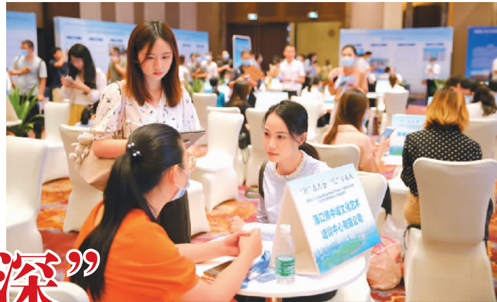
8月6日,海南省2020年首批面向全球招聘三万岗位人才现场对接会暨2020年海南省民营企业专场招聘会在海口举行,吸引众多求职者前来应聘。