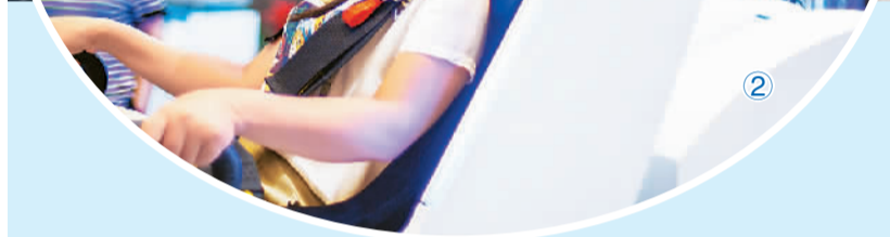
图②：日前，江苏南通市民在体验360度VR技术。